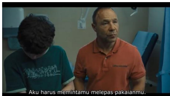
Aku harus memintamu melepas pakaianmu.

Adegan ini terjadi di kantor polisi saat Jamie diperiksa dan diambil sampel darah. Karena masih di bawah umur, Jamie memilih Eddie sebagai pendamping. Eddie berusaha hadir sepenuhnya, menenangkan Jamie, mendampingi pemeriksaan, dan menolak saat petugas menyuruh Jamie melepas seluruh pakaian. Ia tegas berkata, “Dia putraku. Usianya 13 tahun,” sebagai bentuk perlindungan. Adegan ini menunjukkan peran Eddie sebagai ayah secara emosional, moral, dan sosial.