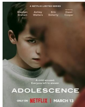
Gambar 1. Poster Serial Adolescence