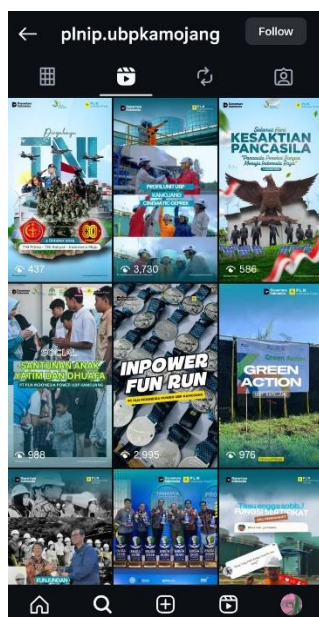
Gambar 5. Reels Kegiatan dan Informasi @plnip.ubpkamojang