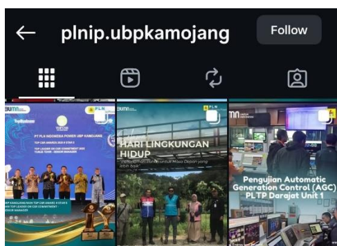
Gambar 6. Feeds Instagram @plnip.ubpkamojang