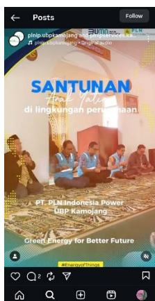
Gambar 3. Reels Rekap Kegiatan PLN IP UBP Kamojang

Pada gambar 3, diperlihatkan salah satu publikasi yang mendukung poin scoring communication , yakni mengenai kaleidoskop perusahaan. Publikasi tersebut mencapai viewers sebanyak 2.319. Publik diharapkan dapat mengetahui kegiatan atau pesan yang diberikan oleh PLN Indonesia Power UBP Kamojang agar tercipta citra yang baik dan positif. Selain itu, dikarenakan PLN Indonesia Power UBP Kamojang memiliki program Praktik Kerja Lapangan (PKL) bagi mahasiswa di seluruh Indonesia, maka beberapa konten di Instagram mengikuti tren generasi muda agar menarik perhatian dan memperlihatkan kepedulian PLN Indonesia Power UBP Kamojang terhadap generasi muda yang ingin mengembangkan soft skill ataupun hard skill melalui program Praktik Kerja Lapangan (PKL). Hal ini didukung oleh pernyataan sebagai berikut.