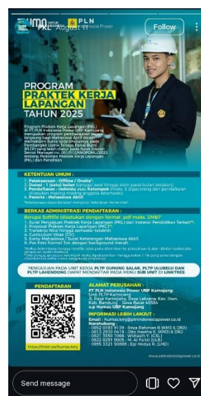
Gambar 4. Story Instagram @plnip.ubpkamojang

Ketiga, membuat konten Instagram sebanyak mungkin. Meskipun publikasi konten di Instagram tidak memberikan poin yang cukup tinggi, tetapi tidak dapat dipungkiri sebagai media sosial yang cukup banyak digunakan oleh masyarakat, maka publikasi konten di Instagram tetap dilakukan dengan frekuensi yang konsisten baik itu dalam bentuk feeds , reels , atau story . Penggunaan Instagram dijadikan sebagai sarana informasi harian yang di mana hal tersebut sering bersangkutan dengan media monitoring yang dapat memberikan poin atau skor.