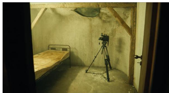
Gambar 3. Ruang Bawah tanah