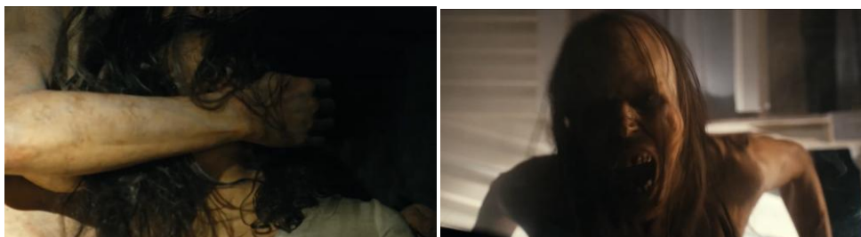
Gambar 6. Sosok Mother (Monster)