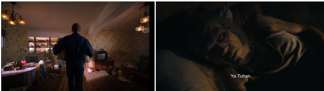
Gambar 4. Frank Menjalankan Aksi Penyekapan