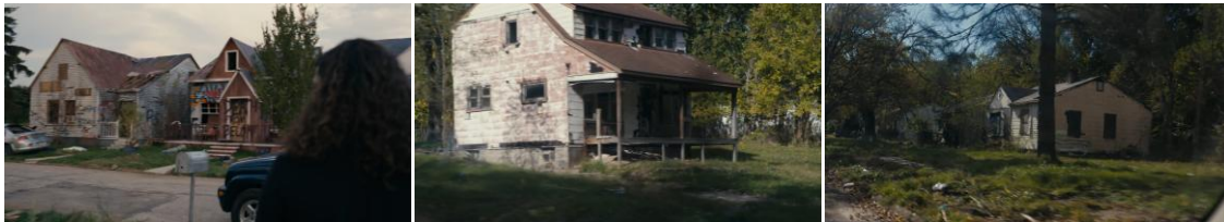
Gambar 2. Setting Perumahan Detroit