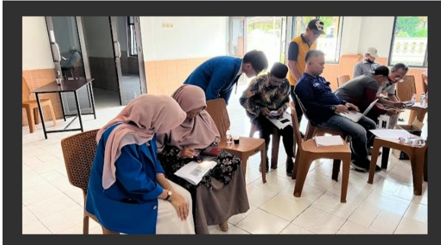
Gambar.1 Peserta Mempelajari Materi

pemasaran digital, dan mendorong pemanfaatan teknologi AI sebagai solusi efektif dalam menghadapi tantangan promosi di era modern.