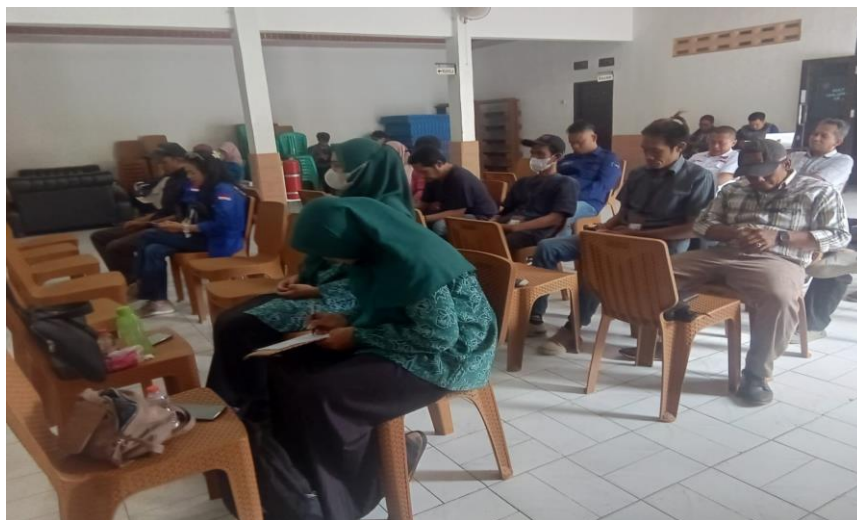
Gambar 2. Pengisian Kuesioner

Setelah pemaparan materi, dilanjutkan dengan pelatihan pembuatan video konten, kemudian peserta diminta untuk mengisi kuesioner untuk mengetahui sejauh mana pemahaman peserta dan kepuasan terhadap materi pada kegiatan Pengabdian kepada Masyarakat ini.