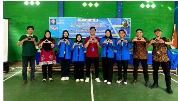
Gambar 7. Foto peserta dan pemateri