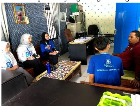
Gambar 1. Proses perizinan tempat

Persiapan, tahap persiapan melibatkan beberapa kegiatan penting, anatara lain: Melakukan observasi lapangan untuk memahami kondisi sosial, level pendidikan, dan isu-isu yang dihadapi masyarakat di Desa Tanjung Saleh, terytama yang terkait dengan pendidikan anak-anak. Mengurus izin untuk kegiatan yang diajukan secara resmi kepada kepala Dusun Tanjung Saleh, termasuk izin penggunaan Aula Kantor Desa sebagai lokasi untuk acara tersebut. Membuat rundown acara yang direncanakan secara terstruktur agar semua rangkaian kegiatan dapat berjalan dengan baik dan efektif. Persiapan konsumsi yang disesuaikan dengan kebutuhan peserta yang mengikuti kegiatan.