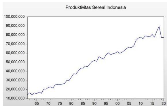
Gambar 2. Grafik Data Time Series Produksi Sereal di Indonesia Terkini

Uji stasioneritas data merupakan kondisi data yang tidak dipengaruhi oleh waktu. Data yang digunakan didapatkan dari World Bank dan United Nation Food Agriculture Organization (FAO) yang diambil mulai dari tahun 1961-2020. Hasil stasioneritas data produksi sereal di Indonesia disajikan pada Gambar 2.