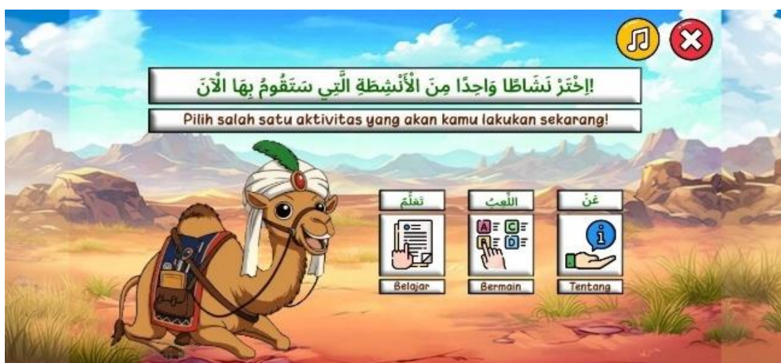
Gambar 3. Tampilan Menu Utama ( Home )

Pada fitur pembelajaran, menu belajar ditampilkan pada Gambar 4, yang memuat delapan kategori mufradat , seperti profesi, alat kelas, warna, dan kategori lainnya. Setiap kategori mengarahkan pengguna ke tampilan materi mufradat seperti yang ditunjukkan pada Gambar 5, yang menyajikan gambar, audio pelafalan, serta arti kata untuk membantu pemahaman kosakata Bahasa Arab.