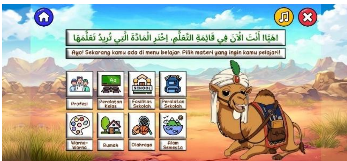
Gambar 4. Tampilan Menu Belajar dan Kategori Mufradat

Pada fitur pembelajaran, menu belajar ditampilkan pada Gambar 4, yang memuat delapan kategori mufradat , seperti profesi, alat kelas, warna, dan kategori lainnya. Setiap kategori mengarahkan pengguna ke tampilan materi mufradat seperti yang ditunjukkan pada Gambar 5, yang menyajikan gambar, audio pelafalan, serta arti kata untuk membantu pemahaman kosakata Bahasa Arab.