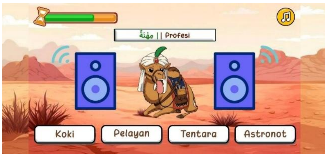
Gambar 8. Tampilan Kuis Menyimak