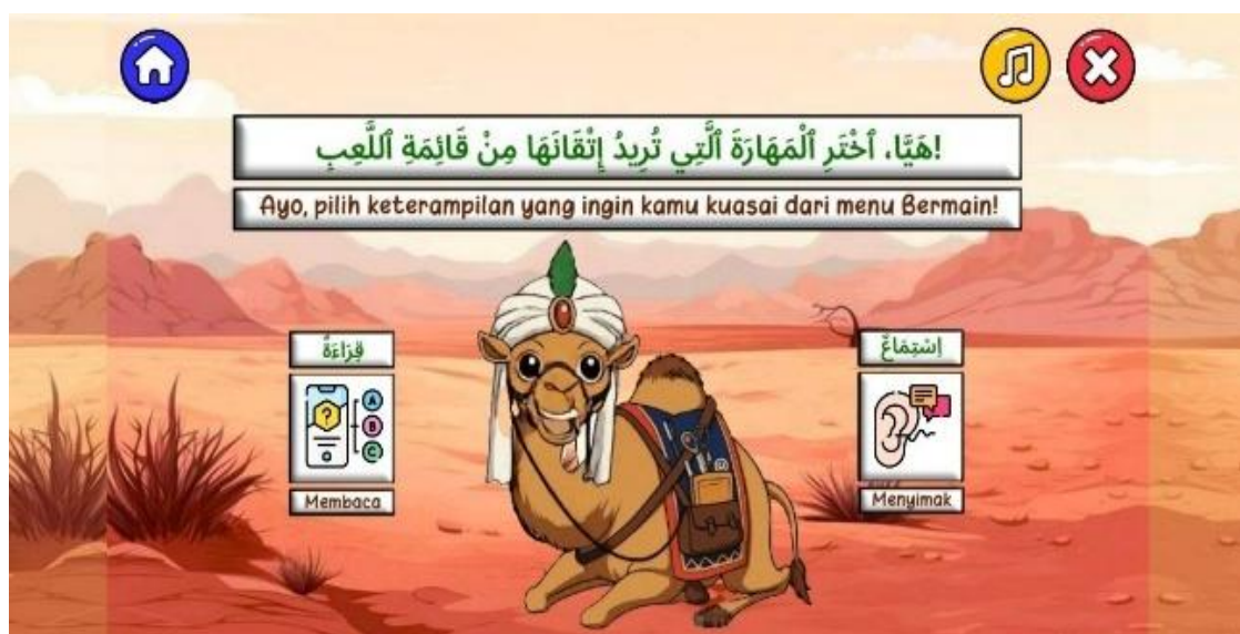
Gambar 6. Tampilan Menu Bermain

Fitur permainan diawali dengan menu bermain yang ditunjukkan pada Gambar 6, yang memberikan pilihan keterampilan membaca dan menyimak. Sebelum kuis dimulai, pengguna akan melihat tampilan petunjuk kuis, yang berisi informasi mengenai durasi pengerjaan, jumlah soal, dan tata cara permainan.