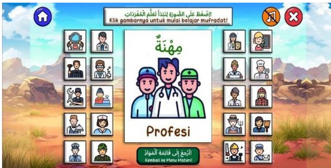
Gambar 5. Tampilan Visual Mufradat dan Audio Pelafalan

Fitur permainan diawali dengan menu bermain yang ditunjukkan pada Gambar 6, yang memberikan pilihan keterampilan membaca dan menyimak. Sebelum kuis dimulai, pengguna akan melihat tampilan petunjuk kuis, yang berisi informasi mengenai durasi pengerjaan, jumlah soal, dan tata cara permainan.