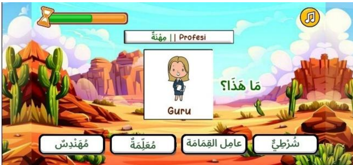
Gambar 7. Tampilan Kuis Membaca