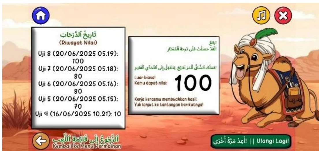
Gambar 9. Tampilan Evaluasi dan Riwayat Skor Pengguna