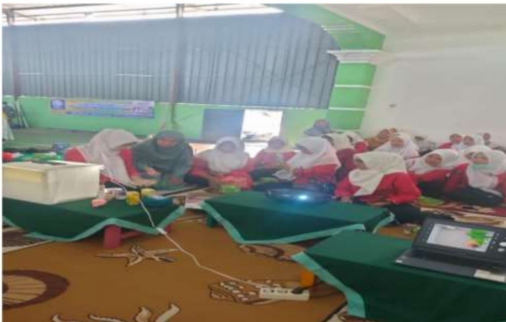
Gambar 2. Demonstrasi Peserta

Pada sesi demonstrasi, peserta diperlihatkan langkah-langkah praktis dalam menggunakan perangkat teknologi untuk mengelola bisnis online, mulai dari pembuatan akun dan toko online di marketplace serta media social, tips dan trik berjualan di media social dalam kegiatan ini menggunakan Instagram, mengoptimalkan profil Instagram bisnis dengan cara mengubah foto profil dan bio jadi semenarik mungkin hingga mencantumkan link toko di profil Instagram, membuat konten yang relevan, memanfaatkan fitur Instagram Shop Instagram Shopping adalah fitur baru Instagram yang didesain untuk membantu brand atau pemilik bisnis online dalam melakukan penjualan. Fitur ini berguna untuk memajang produk sebagai etalase digital di Instagram. Dengan begitu, informasi produk menjadi lebih mudah dilihat oleh audiens. Bahkan menurut penelitian, hampir pengguna Instagram cenderung langsung melakukan pembelian dan mengunjungi website usai melihat produk dari Instagram Shopping. Serta menjalankan strategi marketing Instagram, selain mengoptimalkan profil, membuat konten, dan memanfaatkan fitur Instagram Shopping, cara jualan yang efektif di Instagram tentunya dengan melakukan promosi.