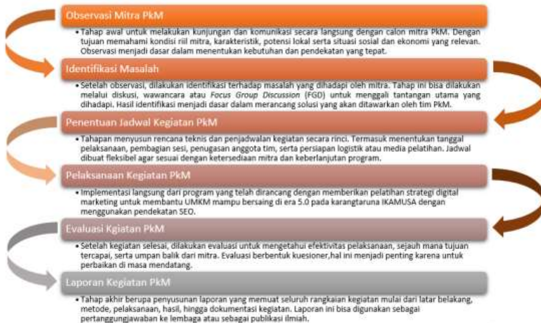
Gambar 1. Tahapan Kegiatan PkM

PkM dilaksanakan oleh 4 dosen dan 5 mahasiswa yang bertugas untuk mendampingi peserta Karangtaruna IKAMUSA, berikut tahapan yang dilakukan dalam kegiatan PkM disajikan pada Gambar 1.