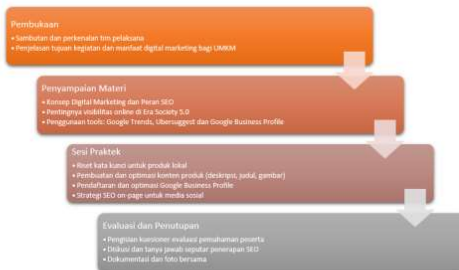
Gambar 2. Tahap Pelaksanaan PkM

Tahapan pelaksanaan kegiatan disampaikan pada Gambar 2. berupa diagram alur sehingga memudahkan untuk dibaca.