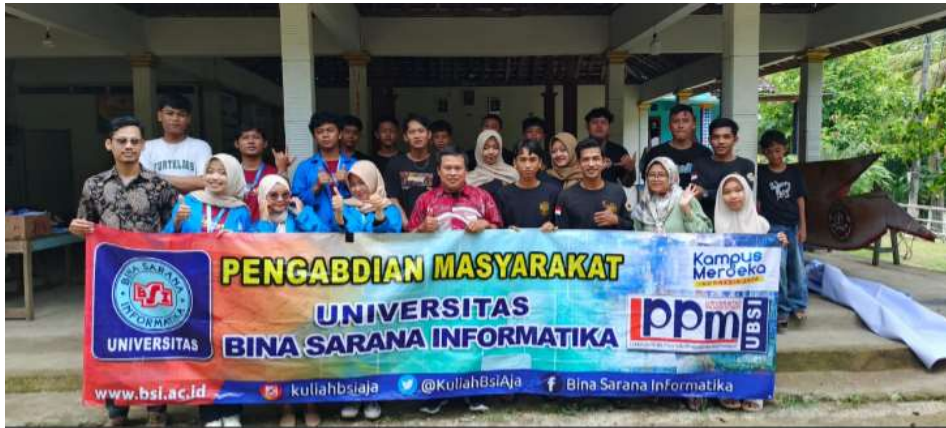
Gambar 5. Dokumentasi Bersama Tim PkM Universitas Bina Sarana Informatika dan Karangtaruna IKAMUSA

Hasil dari kegiatan ini menunjukkan bahwa pemahaman pelaku UMKM terhadap konsep digital marketing dan pentingnya keberadaan di dunia digital meningkat secara signifikan. Para peserta mampu memahami bagaimana mesin pencari bekerja dan bagaimana mereka dapat memanfaatkan teknik SEO sederhana untuk meningkatkan visibilitas produk mereka secara online . Pelatihan ini mencakup materi riset kata kunci, pembuatan konten produk yang ramah SEO, serta penggunaan Google Business Profile untuk menjangkau pasar lokal. Para peserta tidak hanya mendapatkan teori, tetapi juga melakukan praktik langsung yang relevan dengan produk atau jasa yang mereka miliki. Selain itu, kegiatan ini turut mendorong transformasi digital pada UMKM dengan membekali mereka keterampilan untuk memonitor performa digital secara mandiri, baik melalui Google Analytics maupun fitur insight di media sosial. Secara keseluruhan, pendekatan SEO terbukti efektif, efisien, dan dapat diterima dengan baik oleh komunitas, bahkan dalam lingkungan masyarakat yang belum sepenuhnya familiar dengan teknologi digital. Dengan bekal ini, UMKM mitra binaan Karangtaruna IKAMUSA kini lebih siap bersaing di era Society 5.0 melalui strategi pemasaran digital yang terarah dan berkelanjutan.