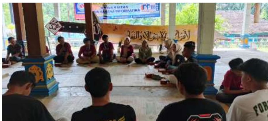
Gambar 4. Dokumentasi Kegiatan PkM berlangsung

Gambar 4 dan Gambar 5 menyajikan dokumentasi kegiatan PkM berupa foto-foto pada saat kegiatan berlangsung bersama peserta karangtaruna IKAMUSA.