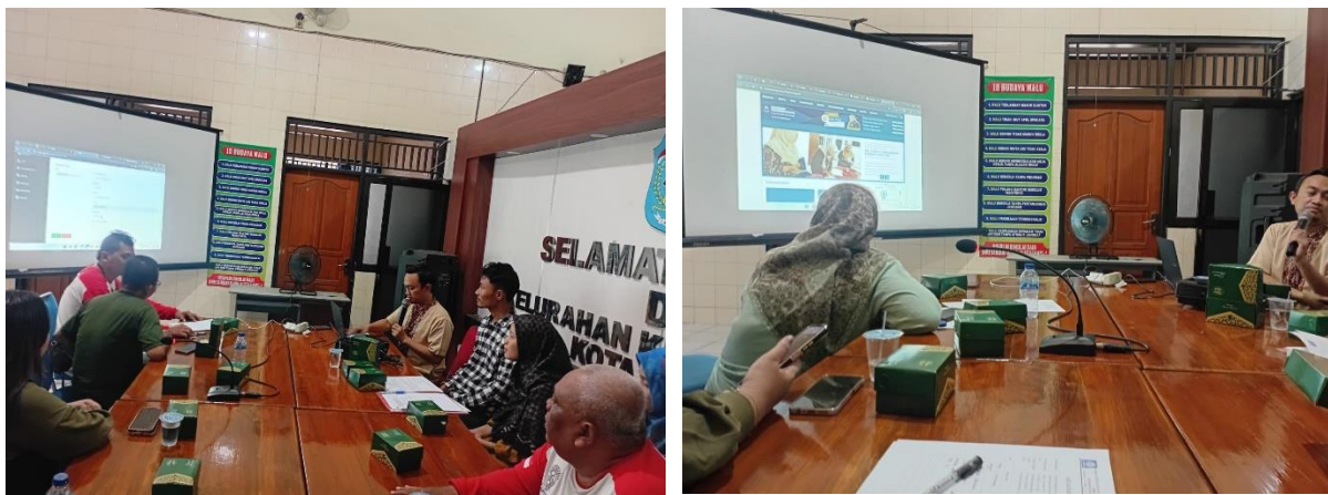
Gambar 3. Dokumentasi Kegiatan Pelatihan Pengelolaan Website di Kelurahan Kemandungan

Sebagai bentuk dokumentasi kegiatan, pelaksanaan pelatihan ini juga didukung dengan pengambilan foto selama kegiatan berlangsung. Dokumentasi ini ditampilkan pada Gambar 3 yang menunjukkan suasana pelatihan, interaksi antara tutor dan peserta, serta proses praktik pengelolaan website.