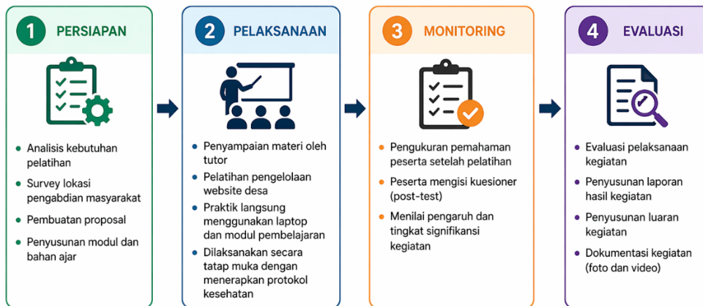
Gambar.1 Tahapan Pelaksanaan