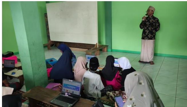
Gambar 2. Peserta sedang menyimak materi yang diberikan

mengelola waktu dan informasi secara bijak. Namun, setelah kegiatan ini dilaksanakan oleh anak asuh Yayasan As-Syamsuriyah, wawasan dan keterampilan peserta dalam menggunakan internet secara sehat dan efektif telah meningkat. Hal ini juga sejalan dengan hasil penelitian yang menyatakan bahwa hasil positif dari kegiatan sosialisasi ini menunjukkan bahwa pendidikan tentang internet yang bijaksana dapat memberikan manfaat yang signifikan (Rahma, et al, 2023). Peserta kini lebih memahami pentingnya etika berinternet, menjaga privasi, dan memanfaatkan teknologi untuk tujuan yang positif.