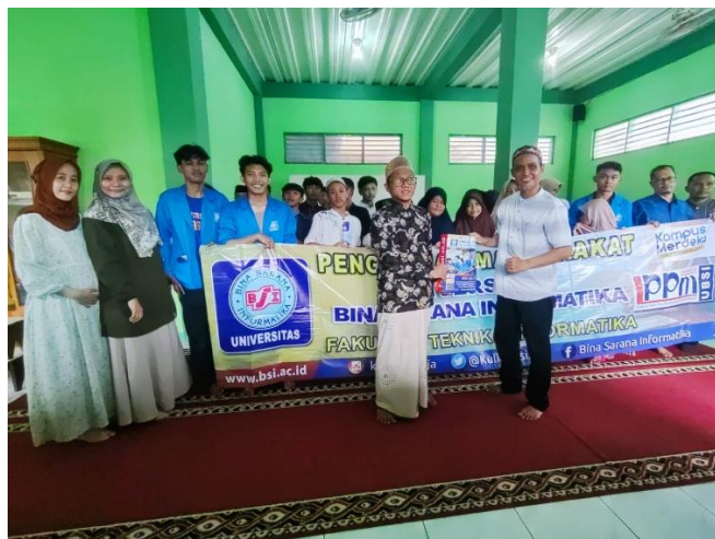
Gambar 3. Peserta PkM berfoto bersama setelah kegiatan selesai

Tabel 1, tabel 2, dan Tabel 3 adalah contoh hasil pengambilan post test yang dilakukan untuk menilai bahwa kegiatan ini berhasil meningkatkan pengetahuan peserta.