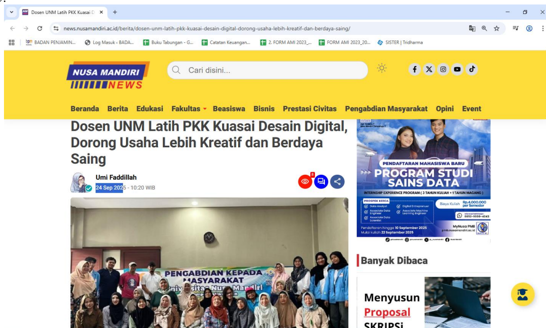
Gambar 5. Dokumentasi Press Release

Pengabdian masyarakat yang telah kami lakukan ini, selanjutnya kami publikasikan melalui press release tingkat nasional dengan Judul “Dosen UNM Latih PKK Kuasai Desain Digital, Dorong Usaha Lebih Kreatif dan Berdaya Saing” yang dapat diakses melalui link https://news.nusamandiri.ac.id/berita/dosen-unm-latih-pkk-kuasai-desain-digital-dorong-usaha-lebih-kreatif-dan-berdaya-saing/ Dipublikasikan pada Tanggal 24 September 2025.