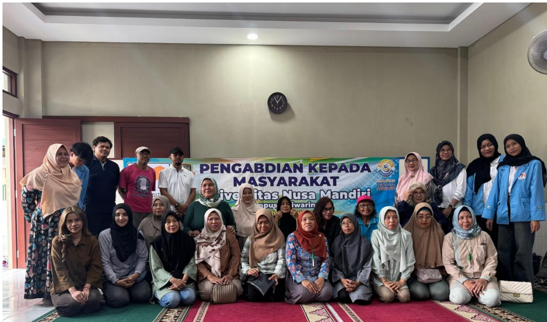
Gambar 4. Foto Bersama Pendamping dan Peserta PkM pada PKK RW 13 Cipinang Melayu

Pengabdian masyarakat yang telah kami lakukan ini, selanjutnya kami publikasikan melalui press release tingkat nasional dengan Judul “Dosen UNM Latih PKK Kuasai Desain Digital, Dorong Usaha Lebih Kreatif dan Berdaya Saing” yang dapat diakses melalui link https://news.nusamandiri.ac.id/berita/dosen-unm-latih-pkk-kuasai-desain-digital-dorong-usaha-lebih-kreatif-dan-berdaya-saing/ Dipublikasikan pada Tanggal 24 September 2025.