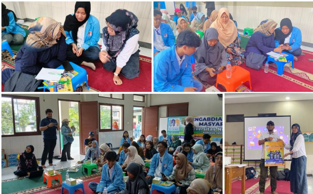
Gambar 2. Bukti Kegiatan Pengabdian Masyarakat pada PKK RW 13 Cipinang Melayu

Kegiatan pengabdian kepada masyarakat ini memberikan berbagai manfaat nyata bagi mitra, khususnya anggota PKK RW 13 Cipinang Melayu. Melalui pelatihan literasi digital, peserta menjadi lebih terampil dalam memanfaatkan smartphone dan aplikasi komunikasi untuk mendukung aktivitas sehari-hari maupun usaha keluarga. Selain itu, keterampilan pemasaran online yang diperoleh melalui media sosial dan marketplace membuat produk lokal yang dihasilkan anggota PKK memiliki akses pasar yang lebih luas dan dikenal oleh masyarakat di luar lingkungan sekitar. Pelatihan pembuatan konten digital juga meningkatkan kreativitas peserta dalam mendesain promosi produk yang lebih menarik dan profesional. Hal ini berdampak langsung pada meningkatnya kepercayaan diri anggota PKK untuk bersaing di era digital. Secara keseluruhan, kegiatan ini berhasil membuka peluang usaha baru, memperluas jaringan pemasaran, serta memberikan kontribusi terhadap peningkatan kemandirian ekonomi keluarga. Dengan bekal keterampilan digital yang diperoleh, mitra diharapkan mampu mengembangkan usaha secara berkelanjutan serta memperkuat daya saing di tengah perkembangan ekonomi digital.