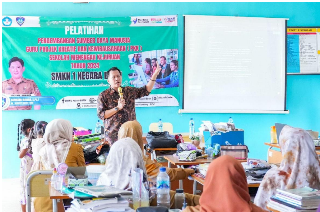
Gambar 3. Pelaksanaan Praktik Kemampuan Public Speaking Guru PKK SMKN 1 Negara Batin

Peningkatan minat guru terhadap public speaking setelah mengikuti pelatihan menunjukkan bahwa kegiatan ini tidak hanya berdampak pada keterampilan teknis, tetapi juga pada motivasi internal peserta. Minat merupakan faktor penting dalam pembentukan kompetensi, karena semakin tinggi motivasi seseorang, semakin besar pula kemauan untuk belajar, berlatih, dan mempertahankan keterampilan yang diperoleh. Hal ini mengindikasikan bahwa pelatihan yang dirancang dengan pendekatan praktik langsung, diselingi umpan balik dan suasana kolaboratif, mampu menciptakan pengalaman belajar yang menyenangkan sekaligus bermakna.