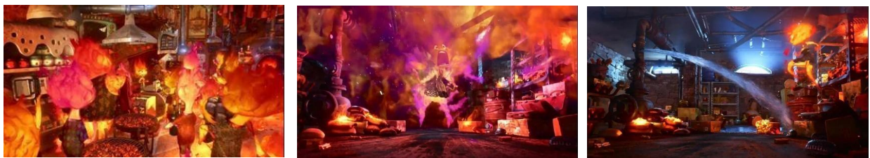
GambarIV. 13, Scene 2 Durasi : 15:05 – 16:00

Konotasi: Simbolisme warna ungu-violet, yang merupakan representasi dari konflik internal yang mendalam antara kemarahan yang diwakili oleh warna merah dan kesedihan yang diwakili oleh warna biru, menunjukkan bahwa, warna ini mengkonotasikan pergulatan emosional yang kompleks dan berlapis-lapis, di samping itu, metafora ledakan tidak hanya mencerminkan kemarahan fisik yang mungkin muncul, tetapi juga menggambarkan "ledakan" identitas yang tertahan, yaitu keinginan yang mendalam untuk keluar dari peran yang dipaksakan oleh lingkungan sekitar.