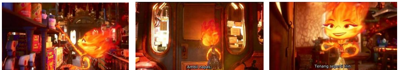
Gambar VI. 13, Scene 2, Durasi : 14:30 – 14:49

Denotasi: Dalam suasana yang tegang di toko keluarga yang rusak akibat ledakan, terlihat ekspresi dan bahasa tubuh yang mencolok, di mana ember berubah warna menjadi ungu-violet, mata melotot, dan tubuh tegang, sementara suara dialog yang berulang-ulang dengan nada frustrasi mengucapkan "Nope! Nope! Nope!" menggema di antara pelanggan yang ketakutan.