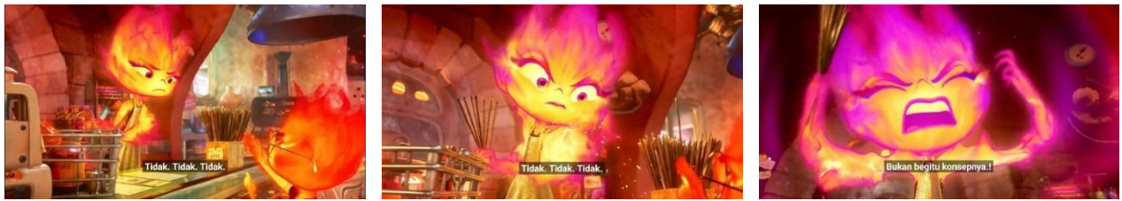
GambarIV. 12, Scene 1 Durasi : 07:17 – 07:50

Konotasi: Simbolisme warna ungu-violet, yang merupakan representasi dari konflik internal yang mendalam antara kemarahan yang diwakili oleh warna merah dan kesedihan yang diwakili oleh warna biru, menunjukkan bahwa, warna ini mengkonotasikan pergulatan emosional yang kompleks dan berlapis-lapis, di samping itu, metafora ledakan tidak hanya mencerminkan kemarahan fisik yang mungkin muncul, tetapi juga menggambarkan "ledakan" identitas yang tertahan, yaitu keinginan yang mendalam untuk keluar dari peran yang dipaksakan oleh lingkungan sekitar.