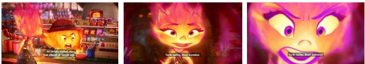
GambarIV. 14, Scene 3 Durasi: 08:17 – 08:33

Konotasi: Ember secara tidak sengaja meledakkan pipa di toko keluarganya ketika emosinya mencapai titik tertinggi, yang menunjukkan bahwa ia sudah tidak mampu lagi mengendalikan perasaan marah, kecewa, dan tertekan yang telah lama terpendam. Ledakan ini bukan hanya sekadar insiden fisik, tetapi juga melambangkan meledaknya konflik batin yang selama ini tertekan akibat ekspektasi besar yang dibebankan kepadanya sebagai anak yang diharapkan untuk meneruskan bisnis keluarga. Dalam adegan ini, warna api yang mengelilingi tubuh Ember berubah menjadi merah menyala, yang secara visual mencerminkan gejala emosi dan ledakan batin yang tak tertahan, serta menunjukkan ketidakmampuannya dalam mengelola tekanan internal dan harapan eksternal yang bertentangan dengan keinginan pribadinya.