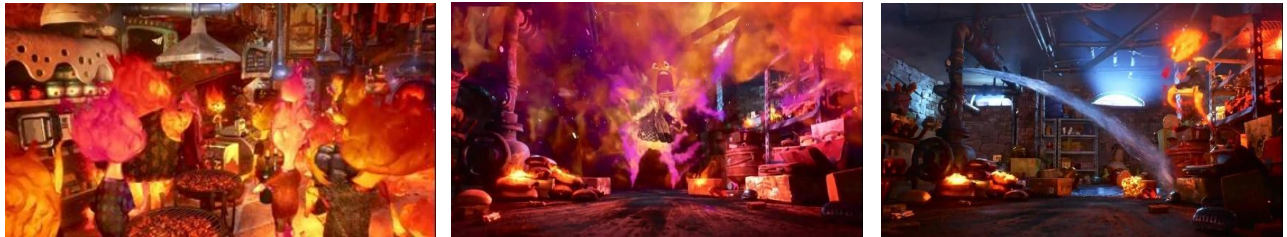
Gambar IV. 12, Scene 1 Durasi : 07:17 – 07:50

Bagian ini bertujuan untuk menyelidiki lapisan-lapisan mitos atau ideologi yang mendasari representasi komunikasi intrapersonal Ember dalam film Elemental . Dalam konteks semiotika yang dikemukakan oleh Roland Barthes, mitos merujuk pada sistem makna tingkat ketiga, yaitu bagaimana makna-makna konotatif yang berulang tidak hanya membentuk citra pribadi seorang tokoh, tetapi juga merepresentasikan narasi yang lebih luas mengenai nilai-nilai sosial, kepercayaan budaya, atau pandangan dunia tertentu. Dengan demikian, komunikasi intrapersonal Ember tidak hanya berfungsi sebagai ekspresi emosional semata, tetapi juga mencerminkan ideologi yang hidup dan diwariskan dalam masyarakatnya termasuk nilai-nilai tentang loyalitas terhadap keluarga, kewajiban untuk meneruskan tradisi, serta mitos mengenai cinta dan identitas.