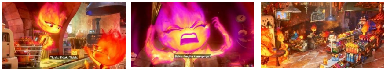
Gambar VI. 12, Scene 1, Durasi : 07:17 – 07:50

Denotasi: Dalam suasana yang tegang di toko keluarga yang rusak akibat ledakan, terlihat ekspresi dan bahasa tubuh yang mencolok, di mana ember berubah warna menjadi ungu-violet, mata melotot, dan tubuh tegang, sementara suara dialog yang berulang-ulang dengan nada frustrasi mengucapkan "Nope! Nope! Nope!" menggema di antara pelanggan yang ketakutan.