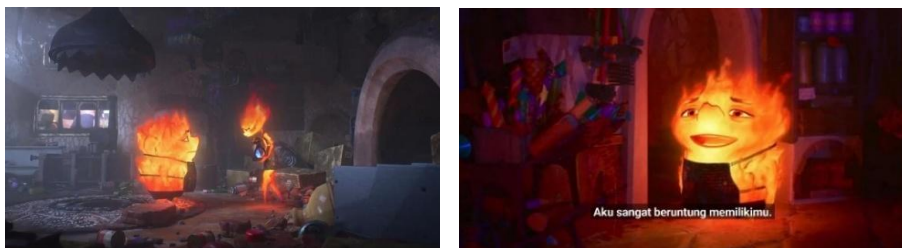
Gambar IV. 15, Scene 4, Durasi: 01:25:00 – 01:26:05

Mitos: Adegan ketika Ember mendengar Wade mengucapkan kalimat "Aku beruntung memilikimu," yang juga pernah diucapkan oleh ayahnya, mengandung makna mitos yang mendalam tentang hubungan antar manusia dan pencarian identitas. Momen ini mencerminkan kenyataan bahwa kata-kata sederhana dapat membangkitkan emosi dan kenangan yang kompleks. Reaksi Ember yang membeku dan perlahan menjauh melambangkan konflik antarmasa lalu dan masa kini, serta hubungannya dengan ayahnya dan Wade. Mitos "beban warisan keluarga" sangat jelas terlihat, di mana anak-anak terjebak dalam harapan orang tua. Selain itu, adegan ini juga menciptakan mitos tentang "ketidaksiapan emosional," yang menunjukkan bahwa meskipun Ember tampak kuat, dia sebenarnya rapuh ketika menghadapi kenangan masa lalu. Momen diamnya juga mencerminkan "komunikasi yang terputus," di mana trauma emosional menghalangi respons terhadap momen positif.