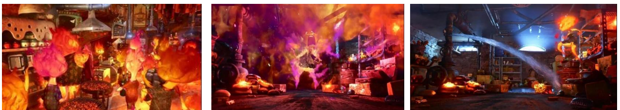
Gambar VI. 14, Scene 3 Durasi : 15:05 – 16:00

Denotasi: Ember mempersiapkan toko lalu mengucapkan frasa pengendalian diri "Take a breath, calm as a candle" sebelum Ember membuka pintu toko. Ember menarik napas dalam dan mengucapkan kalimat tersebut sebagai pengingat untuk tetap tenang, Ember mencoba mengendalikan emosinya agar tidak marah.