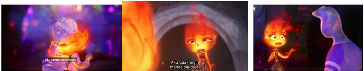
Gambar IV. 14, Scene 3 Durasi: 01:11:45 – 01:12:24

Mitos: Mitos mengenai anak berbakti sering kali terjebak dalam ideologi yang mengharuskan anak untuk menekan keinginan pribadi mereka demi kepentingan keluarga, sehingga ketika muncul ledakan amarah, hal tersebut menjadi manifestasi dari penolakan terhadap peran yang dipaksakan kepada mereka; namun, perasaan bersalah pun menyusul akibat melanggar norma yang mengharuskan mereka untuk menjadi "anak berbakti".