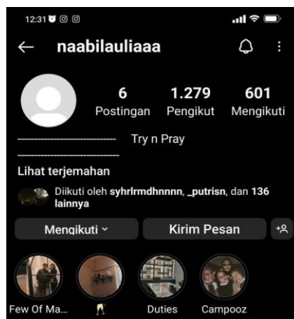
Gambar 2. Akun Instagram Indriyani