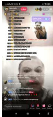
Gambar 1. Konten Self-Harm di Live Streaming TikTok

Aplikasi TikTok memberikan kesempatan kepada penggunanya untuk mendapatkan keuntungan secara materi. Salah satunya melalui gift point yang didapatkan dari penonton, saat melakukan live streaming. Gift point yang dikumpulkan dapat dikonversi menjadi uang dan dikirimkan melalui Paypal. Untuk dapat menukar poin tersebut, TikTok menerapkan sejumlah ketentuan minimal dan maksimal penarikan uang. Adanya rewards ini memicu penggunanya untuk membuat konten kreatif agar menarik perhatian. Sebagai platform User Generated Content (UGC), semakin aktif pengguna TikTok, semakin banyak konten yang dihasilkan. Sehingga semakin banyak pula peluang monetisasi.