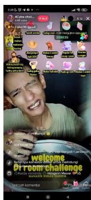
Gambar 2. Konten Self-Harm di Live Streaming TikTok