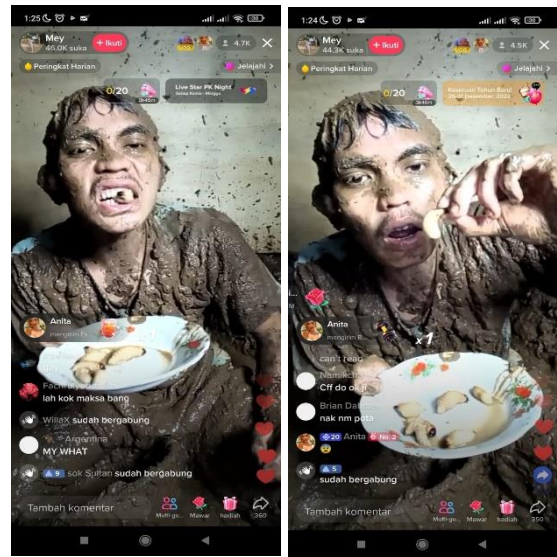
Gambar 5. Fenomena Eating Disorder di Live Streaming TikTok

CCDH memperhitungkan hanya butuh kira-kira 2,6 menit bagi algoritma TikTok untuk memunculkan rekomendasi konten yang mengandung unsur melukai diri dan gangguan makan (eating disorder) kepada remaja perempuan yang masih rentan melakukan hal-hal serupa. Penelitian mengungkap penggunaan akun yang menampilkan karakteristik remaja rentan, cenderung disuguhkan video semacam ini 12 kali lebih banyak daripada saat main TikTok dengan akun biasa.