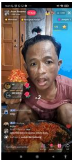
Gambar 4. Fenomena Eating Disorder di Live Streaming TikTok

Selama ini, TikTok menggunakan rekomendasi algoritmik sehingga, orang yang baru mendaftar TikTok untuk pertama kalinya, disajikan dengan feed For You, yang akan menampilkan video tanpa henti berdasarkan tema-tema pilihan minat. Feed “For You” tersebut, disamping memberikan pengalaman yang khas dari TikTok kepada pengguna, justru juga menyimpan bahaya. Terutama bila membaca konten-konten yang melanggar, termasuk diantaranya adalah kampanye suicide dan self-harm. Berkaca dari hasil penelitian yang dilakukan Center for Countering Digital Hate (CCDH) di Inggris bertajuk Deadly by Design menunjukkan fenomena tersebut. Algoritma TikTok berpotensi membahayakan keselamatan remaja, terutama pada konten-konten yang kerap membahas topik self-harm dan bunuh diri.