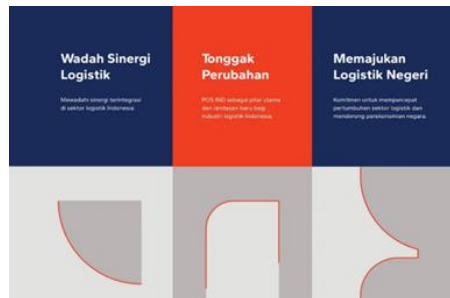
Gambar 3. Filosofi warna Pos Indonesia sebagai penguat Identitas