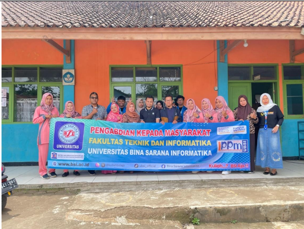
Gambar.2 Pelaksanaan Pelatihan Pengelolaan Data Menggunakan Google Form dan Google Sheet

Pelaksanaan pelatihan dilaksanakan dalam ruangan dan menggunakan laptop/pc ataupun menggunakan handphone. Peserta mendapat pelatihan dalam menggunakan spengelolaan data menggunakan Google Form dan Google Spreadsheet.