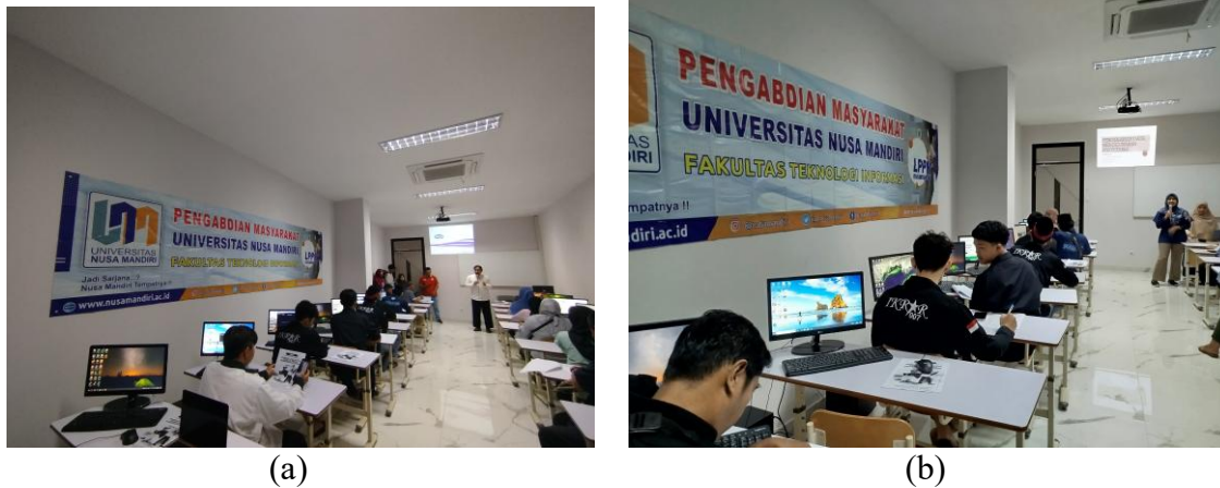
Gambar 4. Sambutan Kaprodi Informatika UNM (a), Pemaparan Materi (b)