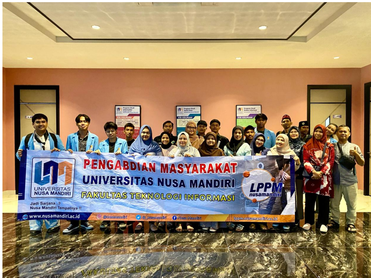
Gambar 5. Foto Bersama Setelah Kegiatan Selesai