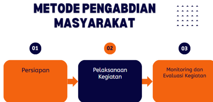
Gambar 2. Metode Pengabdian Masyarakat