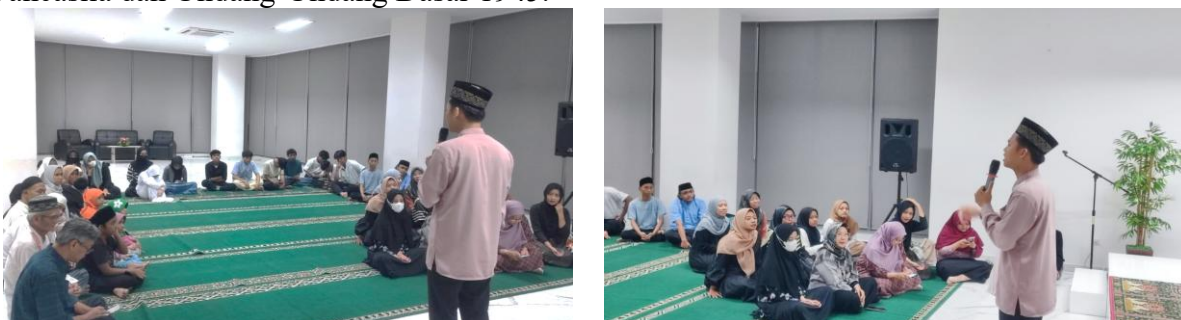
Gambar 1 Dokumentasi Kegiatan Badan Santunan Yatim RW 05,06 dan 07 Depok

Badan Santunan Yatim adalah sebuah badan yang beranggotakan anak-anak yatim RW 05, 06 dan 07 Kelurahan Pondok Cina, Kecamatan Beji Kota Depok. Tujuan Badan Santunan Yatim tersebut adalah terbentuknya pelajar bangsa yang bertaqwa kepada Allah SWT, berilmu, berakhlak mulia dan berwawasan kebangsaan serta bertanggung jawab atas tegak dan terlaksananya syari'at Islam menurut faham ahlussunnah wal jama'ah yang berdasarkan Pancasila dan Undang-Undang Dasar 1945.