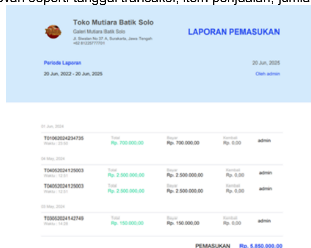
Gambar 1. Contoh Tampilan Laporan Pemasukan (PDF)

Fitur Export Laporan Transaksi Penjualan adalah peningkatan signifikan dalam kapabilitas analisis dan dokumentasi keuangan sistem. Fitur ini menawarkan tiga opsi ekspor data yang fleksibel: berdasarkan bulan, rentang periode tertentu, dan input manual. Setiap opsi ekspor menghasilkan file laporan berformat PDF yang terstruktur dengan baik, memuat rincian transaksi sesuai dengan rentang waktu yang dipilih. Pengujian fungsionalitas ini menunjukkan bahwa laporan yang dihasilkan akurat dan mudah dibaca, menyajikan data yang relevan seperti tanggal transaksi, item penjualan, jumlah, dan total.