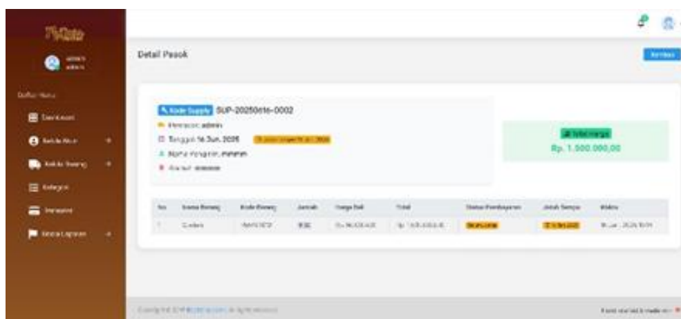
Gambar 3. Halaman Detail Pasok

Jika pengguna ingin mengetahui informasi lebih rinci mengenai suatu barang, tersedia tombol “Detail Pasok” (Gambar 3) yang dapat ditekan. Hal ini akan mengarahkan pengguna ke halaman lanjutan yang berisi data lengkap dari aktivitas pasokan tersebut. Halaman ini merupakan ekstensi dari tampilan utama Pasok Barang, dan mencakup informasi yang lebih mendalam seperti nama pemasok, nama pengirim, alamat pengiriman, nama barang, harga beli, tanggal jatuh tempo, dan status pembayaran. Penyajian informasi yang lebih lengkap ini sangat penting terutama dalam proses konfirmasi data, audit pasokan, maupun evaluasi terhadap mitra penyedia barang.