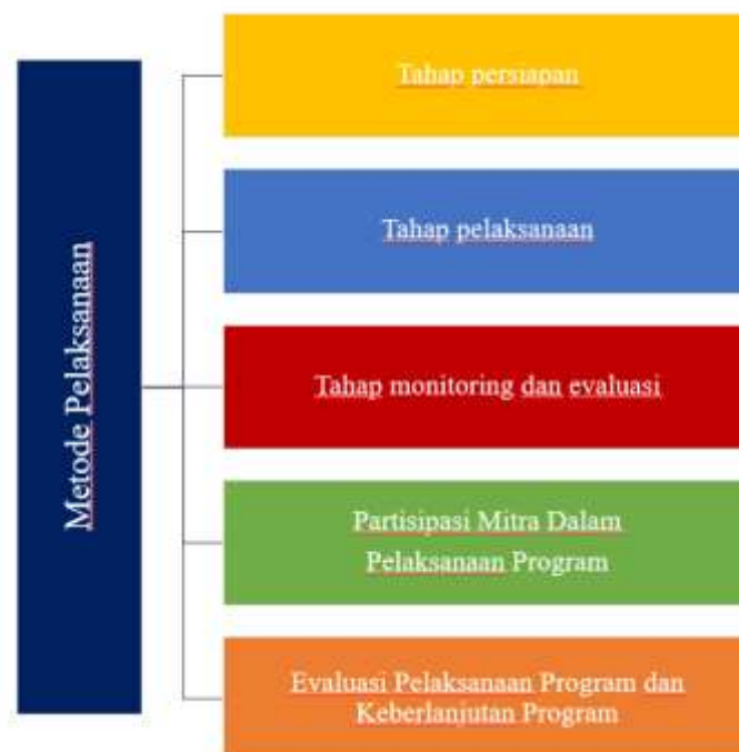
Gambar 1. Tahapan Metode Pelaksanaan

Metode pelaksanaan dalam menyelesaikan permasalahan yang ada di RPTRA Mardani Asri terdiri dari beberapa tahapan sebagai berikut: