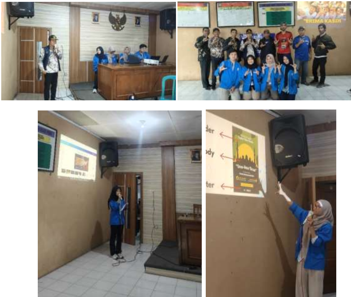
Gambar 2. Bukti Kegiatan Pengabdian Masyarakat pada Desa Batumirah

Melalui kegiatan pengabdian masyarakat yang telah dilaksanakan pada Perangkat Desa dan Warga Desa Batumirah dengan alamat di Jl. Raya Batumirah No.1, Mangli Kidul, Batumirah, Kecamatan Bumijawa, Kabupaten Tegal, Jawa Tengah 52466, Perangkat Desa dan Warga Desa Batumirah telah berhasil memperoleh pengetahuan yang mendalam mengenai cara penggunaan canva. Mereka kini mampu mengenal dan memahami bagaimana cara membuat desain yang menarik, serta dapat memanfaatkannya secara praktis untuk menunjang berbagai kegiatan. Pengetahuan ini tidak hanya memberikan wawasan baru bagi para perangkat desa dan warga desa batumirah, tetapi juga berpotensi meningkatkan efisiensi dan kinerja pemerintahan desa dalam menjalankan program-programnya. Dengan keterampilan baru ini, para perangkat desa dan warga desa batumirah diharapkan dapat berkontribusi lebih maksimal dalam mendukung misi dan tujuan pemerintah desa batumirah.