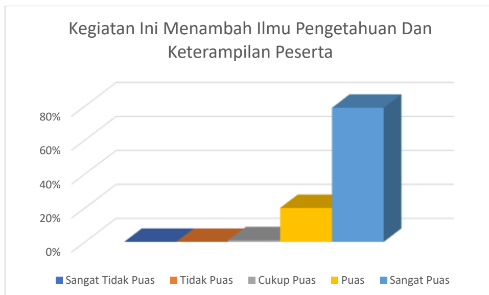
Gambar 4. Menambah Ilmu Pengetahuan dan Keterampilan Bagi Peserta

Dari grafik yang disajikan pada Gambar 3, dapat disimpulkan bahwa secara menyeluruh peserta menunjukkan tingkat persetujuan yang tinggi, bahkan mencapai tingkat sangat setuju, terkait manfaat yang diperoleh dari kegiatan ini. Hasil ini mencerminkan bahwa kegiatan ini dinilai positif oleh para peserta, mengindikasikan adanya kepuasan dan pemahaman yang baik.