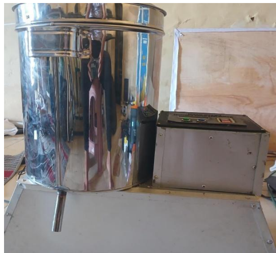
Gambar 4. Teknologi Spinner berbasis mikrokontroler