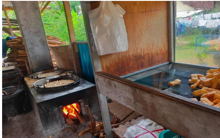
Gambar 3. Pengemasan produk pada mitra

pengembangan teknologi spinner berbasis mikrokontroler pada kegiatan pengabdian masyarakat yang dilakukan.