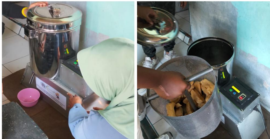
Gambar 7. Pendampingan implementasi teknologi

Sebagai bentuk tindak lanjut dari kegiatan pengembangan teknologi, dilakukan serah terima alat spinner berbasis mikrokontroler dari tim pengabdian masyarakat kepada mitra TAHU KITA. Kegiatan ini merupakan tahap penting karena menandai bahwa mitra telah secara resmi menerima teknologi yang telah dirancang dan siap untuk dioperasikan secara mandiri. Tim pengabdian masyarakat memberikan arahan sehingga mitra dapat mempraktikkan cara pengoperasian spinner sesuai standar. Gambar 8 merupakan dokumentasi kegiatan serah terima alat oleh tim pengabdian masyarakat kepada mitra TAHU KITA.