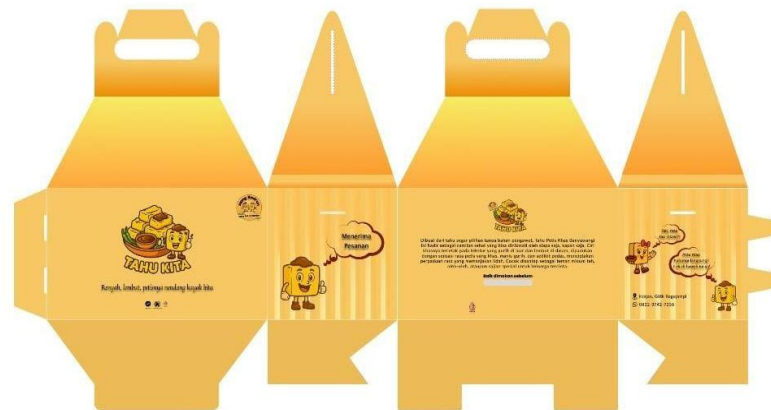
Gambar 5. Desain kemasan produk

Selanjutnya dilakukan kegiatan pelatihan repacking kemasan produk mitra TAHU KITA bersama tim pengabdian masyarakat. Kegiatan ini dilakukan secara langsung bersama tim pengabdian masyarakat dengan tujuan agar mitra mampu memahami sekaligus mempraktikkan proses pengemasan sesuai dengan desain yang telah dirancang. Melalui kegiatan ini, mitra tidak hanya memperoleh kemasan baru, tetapi juga keterampilan praktis untuk mengemas produk dengan lebih profesional. Hal ini diharapkan dapat mendukung keberlanjutan usaha mitra dalam jangka panjang, meningkatkan nilai jual, serta memperkuat daya saing produk di pasar. Gambar 6 menunjukkan praktik pengemasan produk.