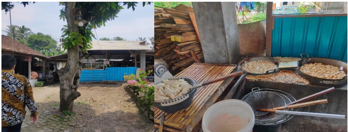
Gambar 2. Observasi Mitra TAHU KITA

Survei lapangan dilakukan oleh tim pengabdian masyarakat pada mitra TAHU KITA di desa Gitik Rogojampi. Kegiatan survei ini bertujuan untuk memperoleh gambaran nyata mengenai kondisi usaha, proses produksi, serta permasalahan yang dihadapi oleh mitra sebelum dilakukan intervensi teknologi maupun pendampingan manajerial. Adapun kegiatan yang dilakukan pada tahapan survei lapangan meliputi: Pertama observasi proses produksi dimana tim melakukan pengamatan langsung terhadap tahapan produksi tahu, mulai dari perebusan kedelai, penyaringan, pencetakan, hingga proses pemotongan. Selain itu, diamati pula proses penggorengan tahu yang masih dilakukan secara manual menggunakan peralatan sederhana; Kedua dokumentasi kegiatan produksi proses penggorengan tahu dan pengolahan dilakukan dokumentasi dalam bentuk foto maupun video kegiatan. Dokumentasi ini digunakan sebagai bahan analisis untuk merumuskan solusi perbaikan yang sesuai dengan kebutuhan mitra; Ketiga identifikasi hambatan teknis dimana tim menemukan beberapa hambatan teknis yang dihadapi mitra; Keempat pemetaan kebutuhan teknologi dimana hasil identifikasi menunjukkan bahwa mitra membutuhkan teknologi tepat guna untuk meningkatkan efisiensi dan kualitas produksi. Dengan dilaksanakannya survei lapangan ini, tim pengabdian masyarakat memperoleh data awal yang komprehensif untuk menyusun rencana pendampingan dan inovasi teknologi. Pada Gambar 2 menunjukkan kegiatan survei lapangan kondisi mitra TAHU KITA.