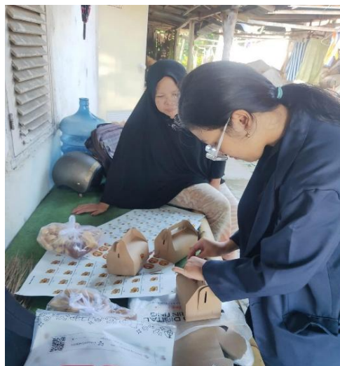
Gambar 6. Praktik pengemasan produk

Selanjutnya dilakukan kegiatan pelatihan repacking kemasan produk mitra TAHU KITA bersama tim pengabdian masyarakat. Kegiatan ini dilakukan secara langsung bersama tim pengabdian masyarakat dengan tujuan agar mitra mampu memahami sekaligus mempraktikkan proses pengemasan sesuai dengan desain yang telah dirancang. Melalui kegiatan ini, mitra tidak hanya memperoleh kemasan baru, tetapi juga keterampilan praktis untuk mengemas produk dengan lebih profesional. Hal ini diharapkan dapat mendukung keberlanjutan usaha mitra dalam jangka panjang, meningkatkan nilai jual, serta memperkuat daya saing produk di pasar. Gambar 6 menunjukkan praktik pengemasan produk.