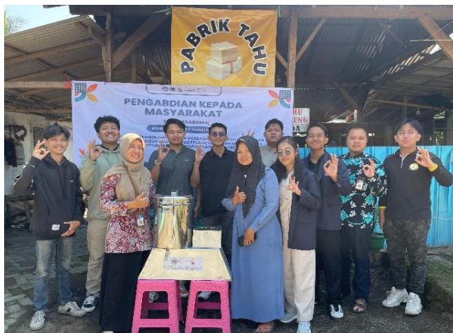
Gambar 8. Dokumentasi penyerahan alat kepada mitra

Sebagai bentuk tindak lanjut dari kegiatan pengembangan teknologi, dilakukan serah terima alat spinner berbasis mikrokontroler dari tim pengabdian masyarakat kepada mitra TAHU KITA. Kegiatan ini merupakan tahap penting karena menandai bahwa mitra telah secara resmi menerima teknologi yang telah dirancang dan siap untuk dioperasikan secara mandiri. Tim pengabdian masyarakat memberikan arahan sehingga mitra dapat mempraktikkan cara pengoperasian spinner sesuai standar. Gambar 8 merupakan dokumentasi kegiatan serah terima alat oleh tim pengabdian masyarakat kepada mitra TAHU KITA.