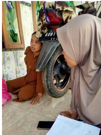
Gambar 2. Kegiatan Observasi dan Edukasi Pengolahan Sampah Organik melalui Maggot kepada Ibu Rumah Tangga di Desa Rejoso Kidul

dokumen dan dokumentasi (Paputungan et al., 2022). Observasi partisipatif dilakukan untuk memahami kondisi nyata di lapangan, pola perilaku masyarakat dan dinamika sosial yang terjadi (Juhanda & Makiyah, 2022). Focus Group Discussion digunakan untuk memfasilitasi diskusi kelompok dan memperoleh perspektif yang beragam dari berbagai elemen masyarakat (Melfazen et al., 2023). Peneliti menganalisis dokumen atau artikel penelitian yang relevan dengan topik penelitian. Dokumentasi kegiatan dilakukan secara sistematis untuk merekam proses dan hasil yang dicapai.