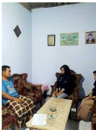
Gambar 1. FGD Perencanaan Program dengan melibatkan Tokoh Masyarakat

Pengumpulan data dilakukan melalui berbagai teknik yang disesuaikan dengan prinsip prinsip PAR yang mengutamakan partisipasi aktif masyarakat ditampilkan pada gambar 1, termasuk wawancara mendalam, analisis