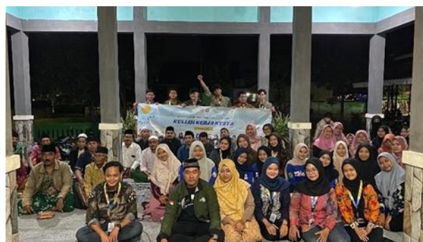
Gambar 11. Dokumentasi Para Mahasiswa dan Masyarakat Setempat Untuk Melakukan Sosialisasi Pengolahan Sampah Organik Melalui Maggot

Meskipun sosialisasi menunjukkan antusiasme yang tinggi dari masyarakat, penelitian ini juga mengidentifikasi beberapa tantangan yang muncul untuk memastikan keberhasilan implementasi teknologi Maggot di masa depan. Tantangan utama yang teridentifikasi adalah keterbatasan pengetahuan teknis masyarakat dalam pengelolaan teknologi Maggot, terutama terkait pengembalian kualitas pakan, manajemen siklus hidup Maggot dan penanganan masalah yang mungkin muncul selama proses produksi. Untuk mengatasi tantangan tersebut, sosialisasi menghasilkan strategi yang komprehensif untuk implementasi teknologi Maggot di masa depan. Strategi pertama adalah penguatan kapasitas masyarakat melalui pelatihan keberlanjutan dan pembentukan kelompok pengelola yang akan dilatih secara khusus. Kelompok ini akan berfungsi sebagai pusat pembelajaran bagi masyarakat lain yang ingin mengadopsi teknologi Maggot. Strategi kedua yang dihasilkan dari sosialisasi adalah pengembangan jejaring pemasaran yang kuat untuk memastikan kontinuitas penjualan produk Maggot di masa depan. Diskusi dalam sosialisasi ini berhasil mengidentifikasi berbagai calon pembeli potensial seperti peternak lokal, toko pakan ternak, dan petani yang membutuhkan pupuk organik.