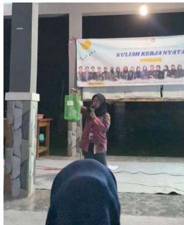
Gambar 10. Pemaparan Materi Sosialisasi Oleh Mahasiswa KKN UINSA