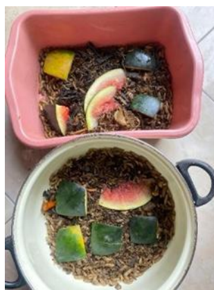
Gambar 9. Pemberian Makan Maggot

Dalam sosialisasi yang disampaikan kepada masyarakat, peneliti menjelaskan bahwa Maggot memiliki kemampuan luar biasa dalam mengkonsumsi berbagai jenis sampah organik seperti sisa makanan, sayuran busuk, buah-buahan yang tidak layak konsumsi dan limbah dapur rumah tangga lainnya. Proses pengolahan sampah melalui Maggot berlangsung secara alami dimana larva-larva tersebut akan memakan sampah organik dan mengubahnya menjadi biomassa yang dapat dimanfaatkan sebagai pakan ternak dan pupuk organik yang kaya nutrisi.