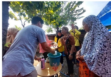
Gambar 2. Penyuluhan budidaya ternak ayam modern Gambar 3. Praktek pembuatan probiotik