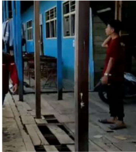
Gambar 3. Lokasi jalan titian di Pondok Pesantren belum di perbaiki dan dimanfaatkan

melalui kegiatan pengabdian masyarakat dapat berpartisipasi aktif memberikan ide dalam konsep perencanaan konsep creative organic dengan ide-ide potensi ruang di jalan titian dan pekarangan rumah dapat ditanami tanaman kebutuhan harian, yang diinginkan untuk keberlanjutan lingkungan.