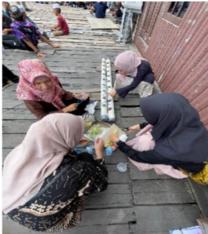
Gambar 2. Pembudidayaan Tanaman secara hidroponik di Kelurahan Langkai

Tim pengabdian FT UPR melalui skim Program Dosen Pendamping Pemberdayaan Masyarakat (PDPPM) mengidentifikasi potensi pekarangan dan jalan titian di sekitar Pondok Pesantren Hidayatul Insan di Kelurahan Langkai banyak digunakan masyarakat untuk ruang bersama(Hamidah, 2024). Tim pengabdian memanfaatkan potensi pekarangan dan jalan titian di Pondok Pesantren sebagai setral pembelajaran mulai ide desain sampai implementasi creative organic di kawasan tepian sungai seperti tertera di Gambar 2.