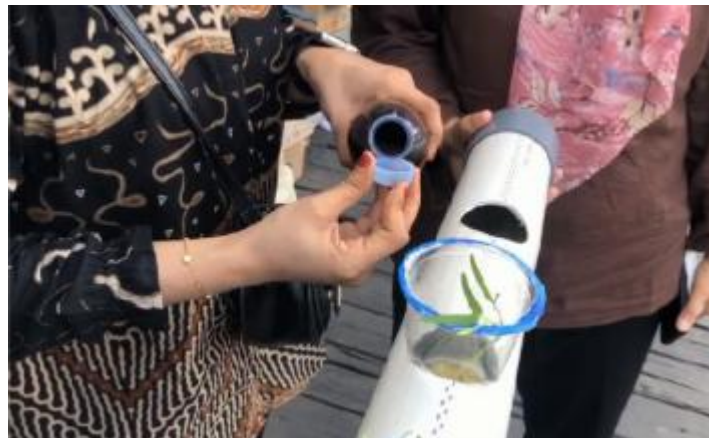
Gambar 5. Praktek Penanaman Sayur dengan Metode Hidroponik

Hasil pengabdian yaitu melatih anak-anak Pondok Pesantren Hidayatul Insan Kelurahan Langkai mengetahui antara lain: (1) Peserta mengerti dan memahami apa itu hidroponik dan mengapa perlunya bercocok tanam sayuran secara hidroponik; (2) Peserta mengetahui jenis-jenis sistem hidroponik; (3) Peserta menanam sayuran dengan cara hidroponik, dimana sebagai salah satu peluang usaha; (4) Peserta sudah mampu menanam sayur-sayuran secara hidroponik dari benih dengan cara hidroponik; (5) terjalin komunikasi dan hubungan baik antara Tim Pengabdian dan peserta pelatihan.