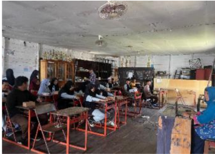
Gambar 4. Kegiatan Sosialisasi Ketahanan Pangan Masyarakat di Tepian Sungai

mengajarkan pola hidup bersih dan sehat seperti tertera pada Gambar 5.