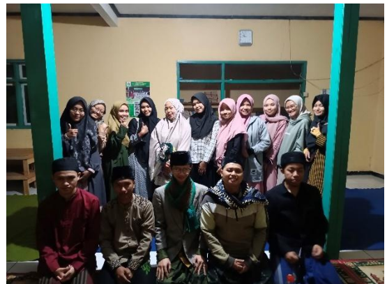
Gambar 2. Kegiatan Pelatihan UMKM

Kegiatan ini bertujuan untuk membuat website resmi Karang Taruna Desa Cihanjavar sebagai media informasi dan promosi program-program yang diadakan oleh Karang Taruna kepada masyarakat desa. Kegiatan ini dilakukan dengan cara: