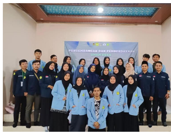
Gambar 1. Kegiatan UMKM