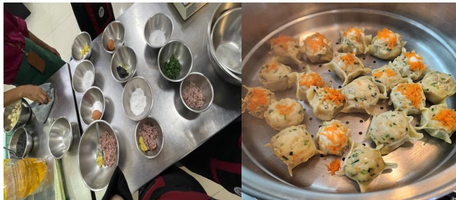
Gambar 2. Uji Coba Pembuatan Produk

Setelah mendapatkan informasi mengenai berlimpahnya ikan bandeng di Kelurahan Keputih, tim pelaksana melakukan uji coba resep olahan ikan bandeng dan didapatkan satu resep yang dirasa cukup menarik untuk dapat menjadi hasil olahan ikan bandeng yaitu siomay bandeng dengan saus hitam. Gambar 2 merupakan hasil uji coba pembuatan produk siomay bandeng yang dilakukan di Laboratorium Pariwisata Universitas Ciputra Surabaya, sebelum diadakannya kegiatan pelatihan. Persiapan ini bertujuan untuk menemukan rasa, tekstur, tampilan yang diinginkan, serta memahami langkah-langkah pembuatan produk tersebut.