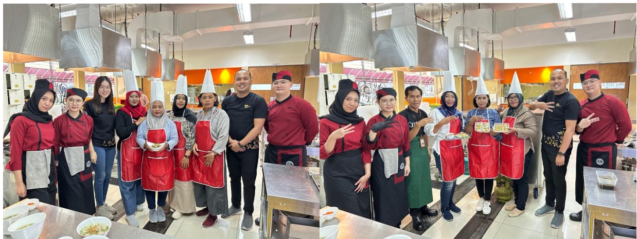
Gambar 5. Dokumentasi Kegiatan Bersama dengan Ibu-Ibu PKK

Kemudahan akses terhadap bahan baku menjadi penting karena berhubungan langsung dengan harga pokok produksi dari produk kedepannya. Semakin susah bahan baku untuk didapatkan, maka semakin tinggi biaya logistik yang dibutuhkan, dan berakibat pada kenaikan harga pokok produksi. Hal ini juga dijelaskan juga oleh Ulfa dkk (2022), dimana harga bahan baku memberikan efek signifikan terhadap harga pokok produksi. Salah satu tantangan pelatihan ini adalah kemampuan peserta dalam mengolah ikan bandeng supaya menghasilkan produk yang konsisten, inovatif, aman untuk dikonsumsi, dan memiliki nilai jual. Selama ini ikan bandeng hanya dikonsumsi sebagai lauk harian, tanpa diolah lebih lanjut. Sehingga pelatihan pembuatan produk siomay berbahan dasar ikan bandeng dinilai cukup efektif untuk membantu menjawab peluang yang ada di Kelurahan Keputih.