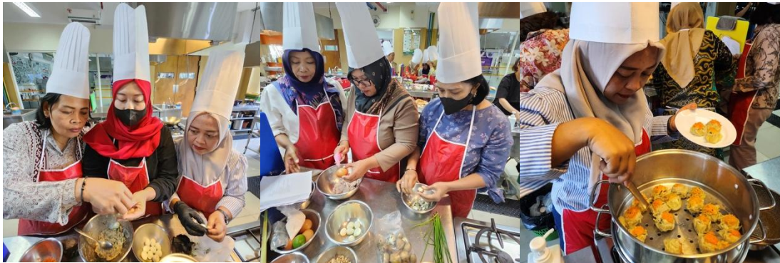
Gambar 3. Pelaksanaan Praktik Pembuatan Produk