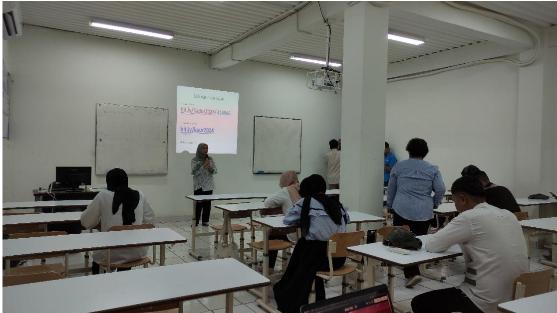
Gambar 1. Tutor Menyampaikan Materi Pelatihan

(0266) 536780 Provinsi Jawa Barat. Kegiatan pengabdian masyarakat ini diselenggarakan berupa pelatihan google form dalam membantu pelaksanaan tugas di Desa Karangtengah Kabupaten Sukabumi. Pengabdian Masyarakat dilaksanakan dengan tema pelatihan google form dalam membantu pelaksanaan tugas yang dihadiri 10 orang dan berlangsung dari jam 08:00-12:00 WIB. Kegiatan pengabdian masyarakat ini dimulai dengan pembukaan oleh ketua panitia, diikuti dengan sambutan dari perwakilan mitra. Setelah sambutan, dilanjutkan dengan acara penyampaian materi tentang penggunaan google form dalam membantu pelaksanaan tugas.