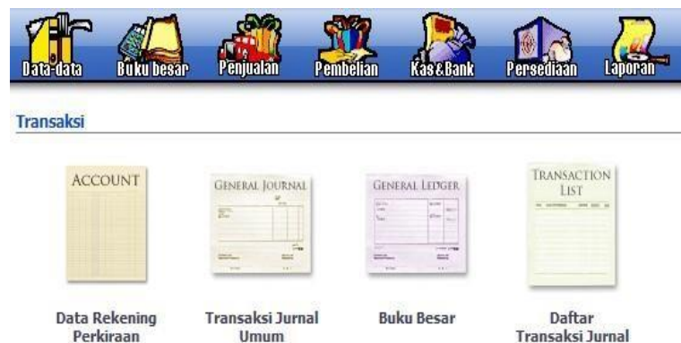
Gambar 3. Tampilan Modul Buku Besar

Modul Buku Besar digunakan untuk input transaksi jurnal umum, membuat daftarakun serta dapat membuka buku besar per-akun.