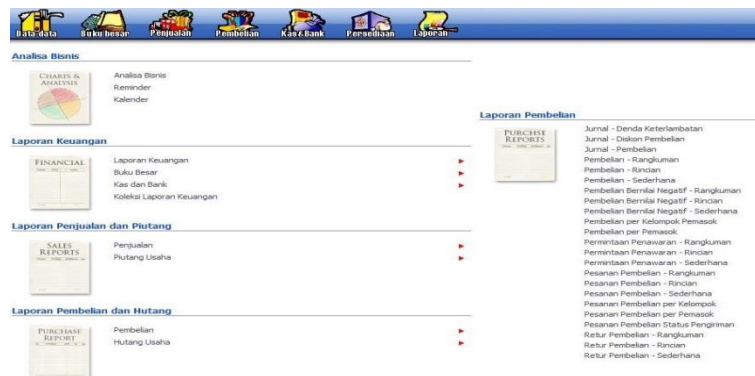
Sumber : Zahir Accounting Versi

Modul Laporan digunakan untuk melihat hasil penginputan dari modul-modul lainnya. Modul laporan juga digunakan untuk melihat perkembangan keuangan perusahaan atau biasa disebut sebagai laporan keuangan. Dalam program Zahir Accounting laporan keuangan tidak hanya disajikan dalam bentuk tabel angka tapi dilengkapi juga dengan laporan berbentuk grafik.