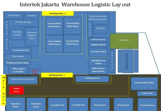
Gambar 2 Tata Letak Gudang Awal PT Intertek

mempunyai ukuran baku. Perusahaan hanya memnetukan jumlah slot untuk masing masing baris. Tata letak awal gudang PT. Intertek Utama Services dapat dilihat pada gambar 1.