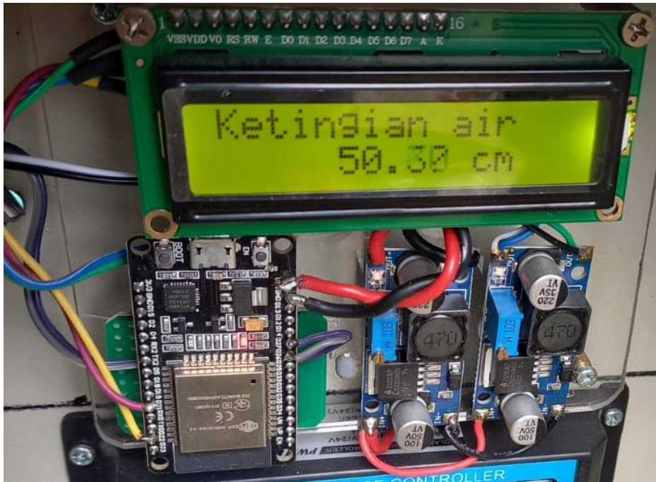
Gambar 2. Perancangan alat

Pada tahap ini perancangan alat dilakukan dengan penuh perhitungan sehingga dapat bekerja dengan maksimal, penempatan dan penyambungan instalasi dilakukan sebelumnya pada aplikasi arduino ide untuk melaksanakan percobaan secara scematik agar tidak terjadinya error pada program(Rangga Parhan et al., 2024).