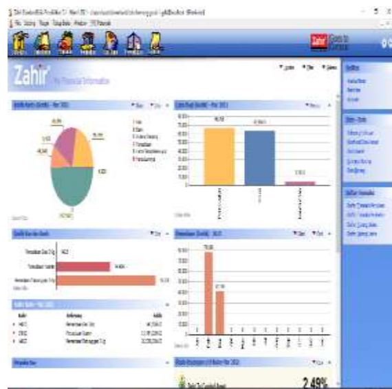
Gambar 13. Tampilan Grafik Analisa Bisnis

Jika seluruh transaksi sudah terinput, maka dapat dilihat pada laporan analisa keuangan. Laporan analisa keuangan digunakan sebagai bentuk evaluasi dan monitoring terhadap perkembangan perusahaan. Laporan analisa keuangan dapat dibaca dengan mudah karena disajikan dalam bentuk tampilan grafik dengan cara Klik Modul Laporan > Analisa Bisnis