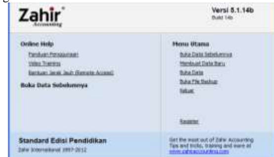
Sumber: (Penelitian, 2021)

Pertama buka program Zahir Accounting Versi 5.1, maka akan tampil menu utama seperti gambar berikut. Kemudian klik membuat data baru.