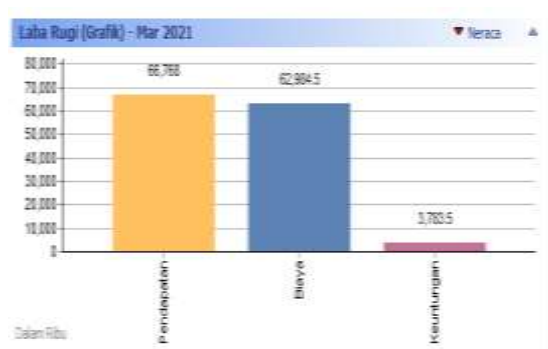
Gambar 14. Grafik Laba Rugi

Dapat terlihat pada gambar 14 diatas terdapat grafik laba rugi, Kemang Grosir Bogor pada bulan Maret 2021 menghasilkan pendapatan sebesar Rp. 66.768.000, biaya yang dikeluarkan sebesar Rp. 62.984.500 dan memperoleh laba sebesar Rp. 3.783.500.