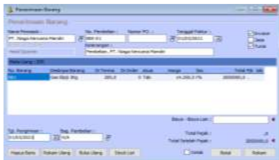
Gambar 9. Input Data Pembelian

Input data transaksi pembelian pada tanggal 1 Maret 2021, pembelian gas Elpiji 3 Kg sebanyak 200 tabung kepada PT. Niaga Kencana Mandiri secara tunai (BKK-01). Pilih modul Pembelian > Penerimaan Barang ( Invoicing ). Checklist pada checkbox Invoice dan Tunai. Isi data sesuai faktur pembelian kemudian klik Rekam.