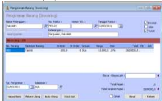
Gambar 10. Input Data Penjualan

Input data transaksi penjualan pada tanggal 2 Maret 2021, penjualan secara tunai kepada Pak Adih 200 dus air mineral Yasmin (FPJ-02). Pilih modul Penjualan > Pengiriman Barang ( Invoicing ). Checklist pada checkbox Invoice dan Tunai. Isi data sesuai faktur penjualan kemudian klik Rekam.