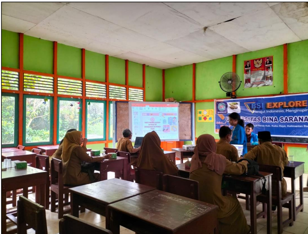
Gambar 1. Pemaparan materi tentang aplikasi Canva

Evaluasi tertulis dalam bentuk test dilakukan pada sesi akhir kegiatan untuk mengetahui pemahaman guru di SDN 23 dan 25 Teluk Pakedai Kalimantan Barat terhadap materi yang diberikan. Pada sesi terakhir, guru-guru diberikan kuesioner ketertarikannya menggunakan Canva dalam pembuatan video pembelajaran. Hal ini bertujuan untuk mengetahui efektifitas dari kegiatan pelatihan.