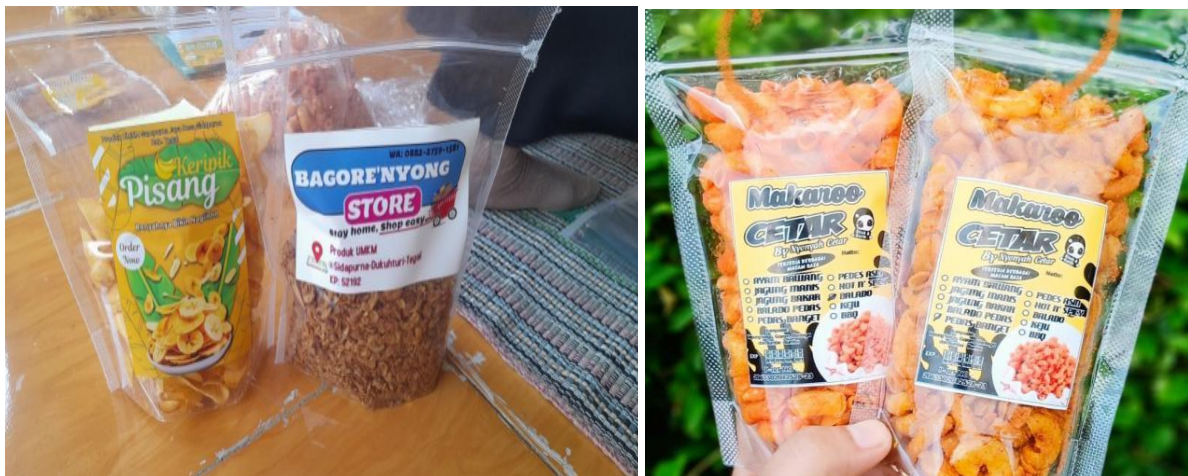
Gambar 3. Hasil Packaging Produk dengan label

Produk UMKM selain memiliki label/merek yang menarik tentunya juga harus memiliki packaging produk yang bagus dan menarik seperti gambar 3.