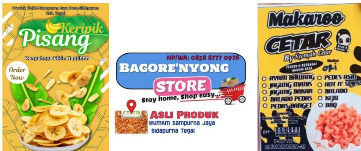
Gambar 2. Hasil Desain Label Produk

Pelatihan ini memberikan pemahaman kepada pelaku UMKM mengenai konsep branding, seperti cara merancang logo, tagline, dan gaya visual yang sesuai dengan karakter produk. Peserta juga diajarkan bagaimana membuat identitas merek yang menarik dan konsisten untuk menarik perhatian konsumen. Peserta mendapatkan keterampilan untuk mendesain kemasan produk yang lebih modern, menarik, dan sesuai dengan tren pasar. Desain kemasan yang menarik diharapkan dapat meningkatkan daya tarik produk dan membantu UMKM bersaing dengan produk-produk lainnya. juga memberikan wawasan mengenai pentingnya pemanfaatan teknologi informasi, seperti pemasaran melalui media sosial dan platform digital untuk meningkatkan visibilitas produk di pasar yang lebih luas.