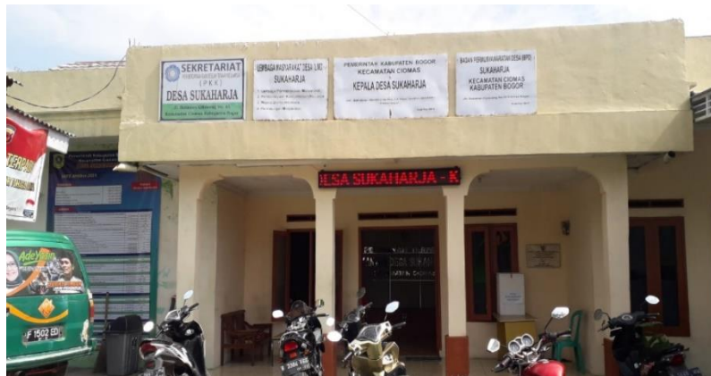
Gambar 2. Bagian Depan Kantor Sekretariat Karang Taruna Desa Sukaharja

Lokasi Sekretariat Karang Taruna Desa Sukaharja Jalan Raya Babakan Cipayung No. 13 RT 01 RW 02 Desa Sukaharja Kecamatan Ciomas Kabupaten Bogor Provinsi Jawa Barat. Sementara itu, jarak antara Kantor Sekretariat Karang Taruna Desa Sukaharja dengan Kampus Universitas Bina Sarana Informatika Cabang Bogor berdasarkan data dari google maps adalah sekitar 13,9 km dengan jarak tempuh sekitar 46 menit.