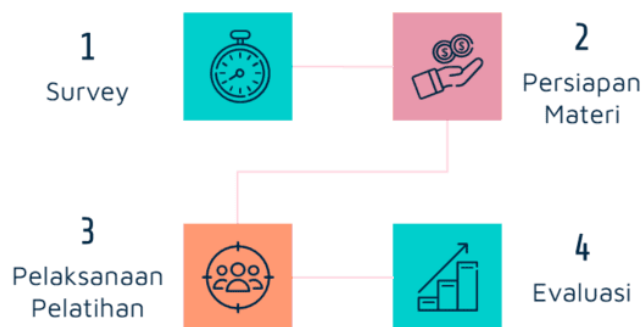
Gambar 1. Tahapan Kegiatan Pengabdian Kepada Masyarakat

Dalam mengatasi permasalahan yang dihadapi pengurus Yayasan Pendidikan dan Kesejahteraan Islam Al Muhajirin Kota Bogor diperlukan workshop yang menarik sehingga kegiatan pemanfaatan teknologi dalam pembuatan website lebih maksimal.