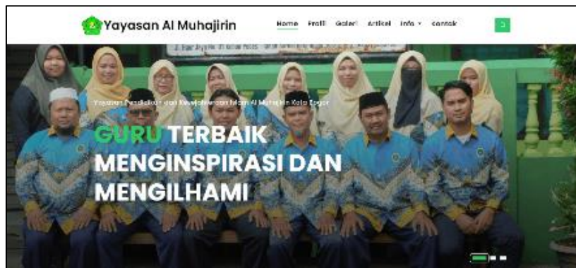
Gambar 6. Tampilan Sistem Informasi Yayasan Al Muhajirin

Gambar 6 menunjukkan Tampilan awal dari Sistem Informasi Yayasan Al Muhajirin. Tampilan ini dilengkapi dengan slider gambar yang akan berubah pada rentang waktu tertentu untuk memperlihatkan kegiatan dan dokumentasi Yayasan Al Muhajirin terbaru. Tampilan ini merupakan sambutan awal untuk pengunjung yang akan mengakses Sistem Informasi Yayasan Al Muhajirin. Pada bagian atas dan bawah halaman dilengkapi dengan berbagai menu yang dapat membantu pengunjung mendapatkan informasi mengenai Sistem Informasi Yayasan Al Muhajirin.