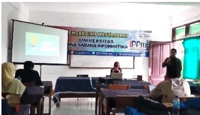
Gambar 5. Memberikan informasi dan Pelatihan Sistem Informasi berbasis Website

Kegiatan pelatihan ini disampaikan dengan metode ceramah ceramah, praktik dan diskusi untuk memperkenalkan sekaligus mengajak para peserta dengan menumbuhkan motivasi peserta mengenai pentingnya Sistem Informasi berbasis website yang melibatkan tiga dosen dan 2 mahasiswa yang memiliki keahlian pada bidang sistem informasi. Pada Gambar 5 menunjukkan Bapak Ahmad Al Kaafi, M.Kom selaku Ketua Tim Pengabdian Kepada Masyarakat memberikan feedback terhadap usulan dari peserta.