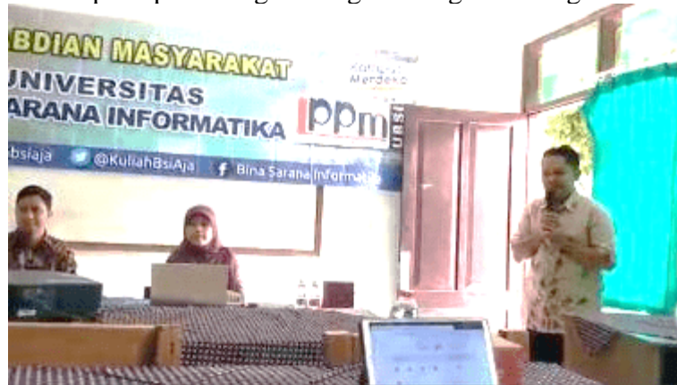
Gambar 2. Pembukaan Kegiatan Oleh Ketua Yayasan Al Muhajirin.

Gambar 2 menunjukkan Ketua Yayasan Al Muhajirin Kota Bogor memberikan sambutan pada pembukaan kegiatan pengabdian kepada masyarakat. Ketua Yayasan Al Muhajirin Kota Bogor menyampaikan terima kasih kepada Tim Pengabdian Kepada Masyarakat dan memberikan arahan kepada peserta agar mengikuti kegiatan dengan aktif.