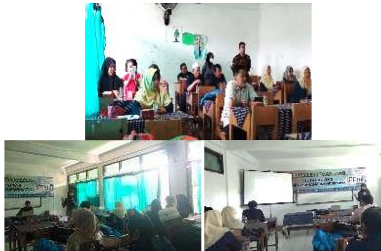
Gambar 3. Penyampaian Materi Pelatihan

Gambar 3 menunjukkan rangkaian kegiatan penyampaian materi yang dimulai dengan pengenalan sistem informasi, pembuatan sistem informasi, hingga diskusi antara peserta dan tutor serta anggota tutor.