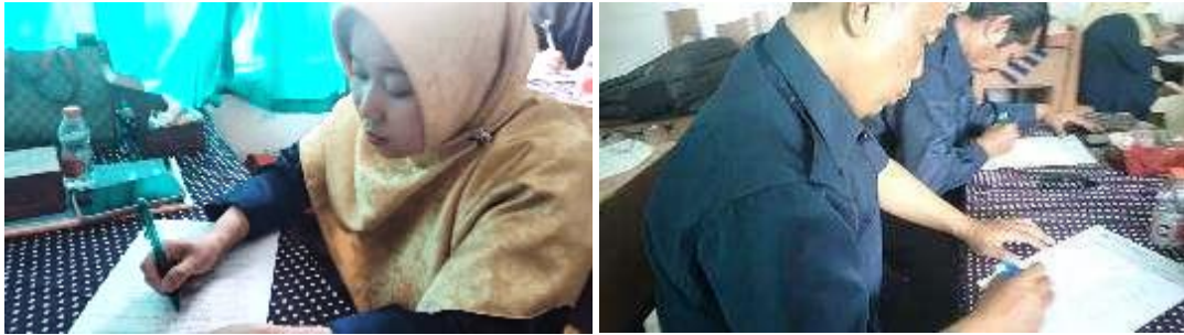
Gambar 4. Pengisian Kuesioner