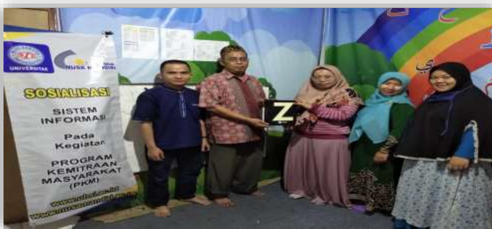
Gambar 6 Penyerahan Aplikasi Zahir