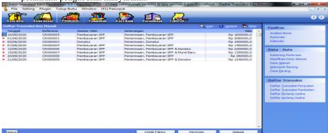
Gambar 4 Penginputan Transaksi

d. Penginputan transaksi-transaksi keuangan oleh peserta pengabdian masyarakat menggunakan zahir accounting yang telah diinstal sebelumnya di bantu oleh panitia pelaksana pengabdian masyarakat.