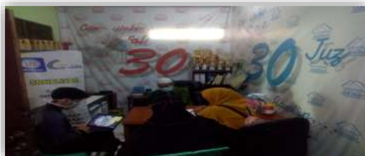
Gambar 2 Kegiatan Diskusi