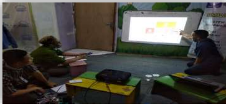
Gambar 1 Kegiatan Tutorial