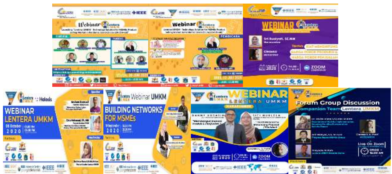
Gambar 3. Flyer Seminar/Workshop/Pelatihan

Ipunk Snack & Cookies dengan pemilik Ibu Purwanti dapat mengikuti kegiatan pendampingan UMKM dari awal sampai akhir. Dalam kegiatan ada proses pendampingan kegiatan Seminar/Workshop/Pelatihan yang sudah diikuti Ibu Purwanti selaku pemilik Ipunk Snack & Cookies, antar lain: Webinar Selasa, 30 Juni 2020 ( Launching “Lentera UMKM” ), Webinar Rabu, 22 Juli 2020 ( Training for product photography and brochure for MSMEs ), Webinar Rabu, 5 Agustus 2020 ( Training how to make a simple financial report for MSMEs ), Webinar Kamis, 10 September 2020 ( Training to MSMEs on network building ), Webinar Rabu, 30 September 2020 ( Training to MSMEs on Building Innovation Product & Selling for MSMEs ), Webinar Kamis, 8 Oktober 2020 ( Provision of Workshop Materials by Sales Platform Partners ), Forum Group Discussion Sabtu, 14 November 2020, Laporan Pendampingan dan Evaluasi Kegiatan Lentera UMKM Selasa, 1 Desember 2020