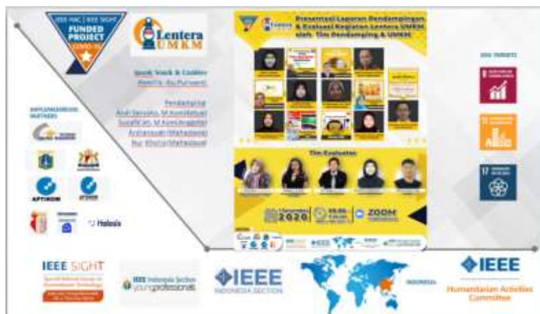
Gambar 5. Cover Presentasi Laporan Kegiatan

Untuk proses kegiatan selanjutnya adalah Pendampingan penggunaan Web Lentera UMKM. Untuk produk-produk Ipunk Snack & Cookies sudah berhasil diupload dan dipasarkan pada Web Lentera UMKM.