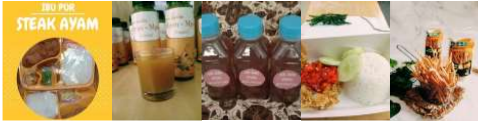
Gambar 1. Produk-Produk Ipunk Snack & Cookies

pembeli dapat langsung melihat katalog, memilih menu dan memilih produk-produk yang ingin dibeli, sampai dengan konfirmasi pembayaran. Adapun produk-produk yang ditawarkan di Ipunk Snack & Cookies terlihat di gambar 1.