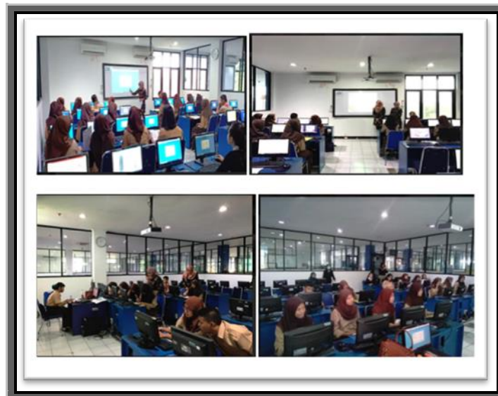
Gambar 2. Suasana Penyampaian Materi Teori Akuntansi dan Praktik Penggunaan Zahir Accounting