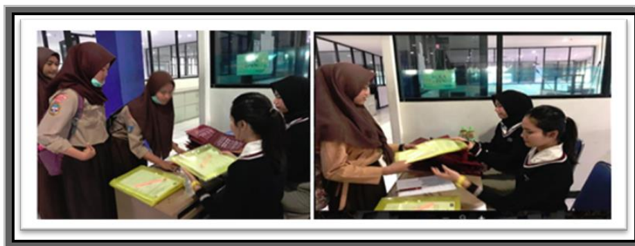
Gambar 1. Registrasi Peserta Abdimas di Laboratorium Komputer

Setelah diberikan pelatihan dengan metode ceramah dilanjutkan dengan pemberian praktik penggunaan aplikasi zahir accounting dalam menyusun laporan keuangan. Praktik pemanfaatan zahir accounting meliputi semua modul yaitu pembuatan database perusahaan, setting saldo awal akun, pembuatan database customer , database supplier, database persediaan barang dagang, transaksi pembelian, transaksi penjualan, transaksi retur, sampai dengan ouput hasil laporan keuangan. Penyusunan laporan keuangan dengan menggunakan zahir accounting dapat diterima dengan mudah oleh para peserta, karena Bahasa yang ada dalam aplikasi tersebut adalah Bahasa Indonesia. Selain itu peserta merasakan manfaat dari proses siklus akuntansi yang dapat dilakukan dengan cepat dan tepat menggunakan bantuan pemanfaatan perangkat lunak zahir accounting. Suasana pemberian materi dapat dilihat pada gambar 2. Pelatihan dilanjutkan dengan sesi tanya jawab diskusi, kemudian pemberian kuesioner untuk evaluasi kegiatan pelatihan abdimas serta diakhiri dengan pemberian cinderamata kepada perwakilan sekolah (gambar 3).