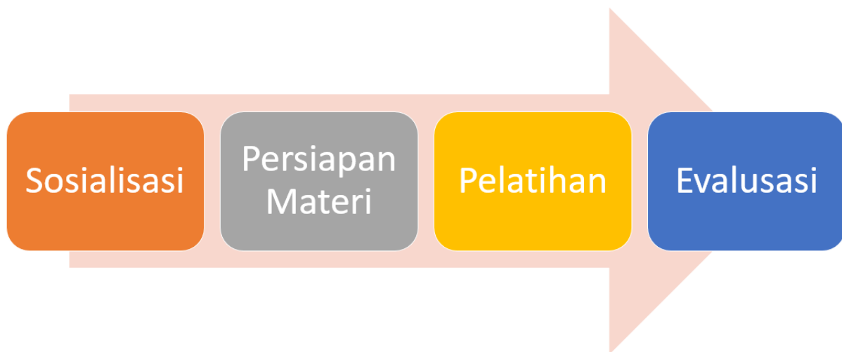
Gambar 1. Tahapan Kegiatan Pengabdian Kepada Masyarakat

Metode yang diberikan dalam kegiatan ini berupa pelatihan kepada Unit Kerja Karang Taruna (UKKT) RW.06 Tegal Parang terletak di Jl. Mampang Prapatan VII RW.06. Tegal Parang Kec. Mampang Prapatan Jakarta Selatan 12790 dengan tahapan-tahapan sebagai berikut :