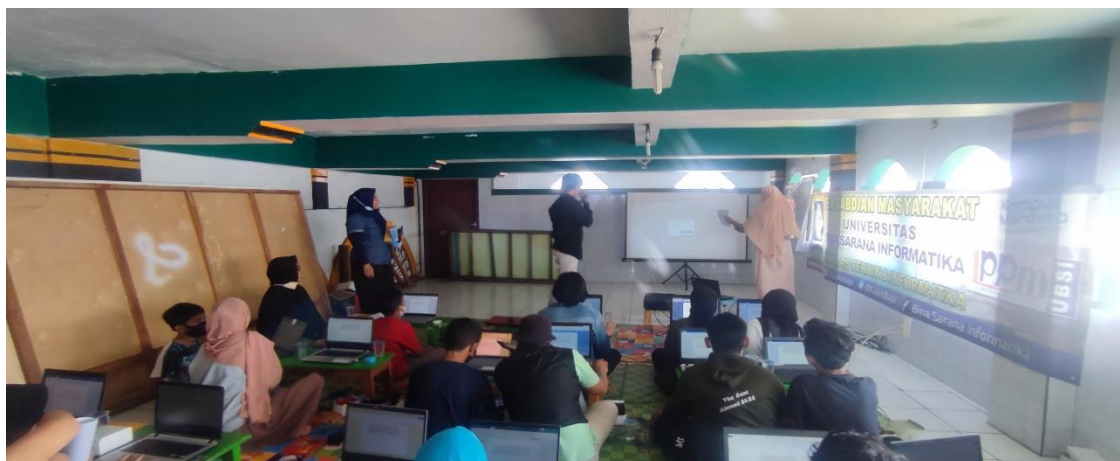
Gambar 3. Pelatihan Ms.Excel

Gambar 3 Pelatihan dimulai setelah Office 2016 telah siap digunakan. Para peserta terlihat antusias dan semangat mengikuti pelatihan ini.